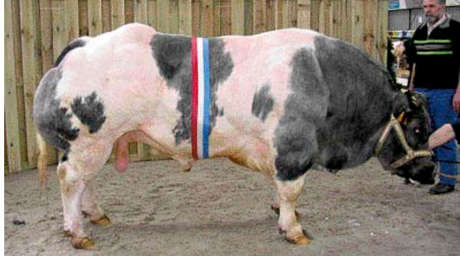
Houblon de Centfontaine (v. Radar van Terbeck), dagkampioen Belgisch witblauw mannelijk