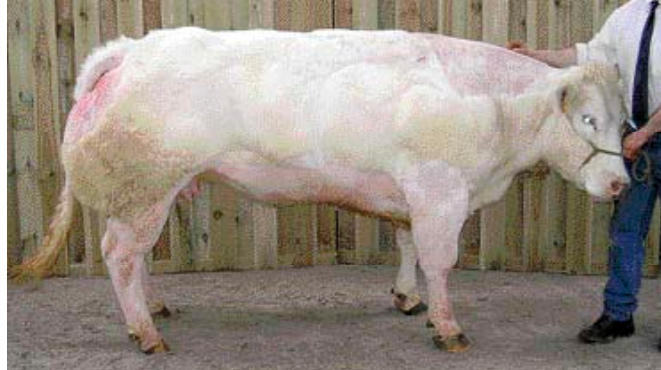
Effigie de la Coloterie (v. Lasso), dagkampioene Belgisch witblauw vrouwelijk