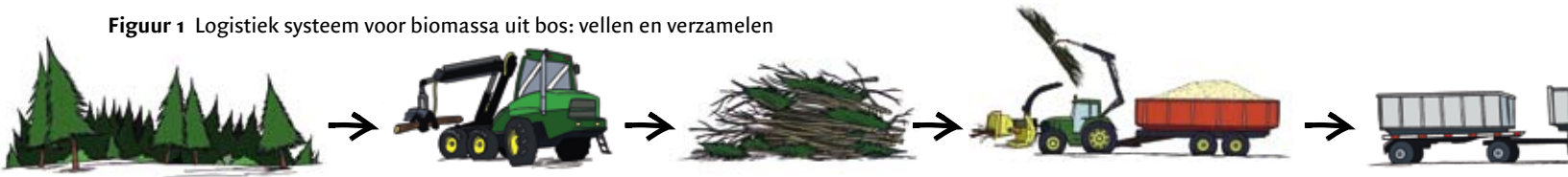
Figuur 1 Logistiek systeem voor biomassa uit bos: vellen en verzamelen