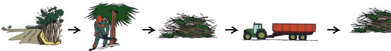
Figuur 2 Logistiek systeem voor biomassa uit kleine landschapselementen: direct afvoeren

In de studie zijn een aantal voorbeelden van logistieke systemen rondom regionale biomassawerven