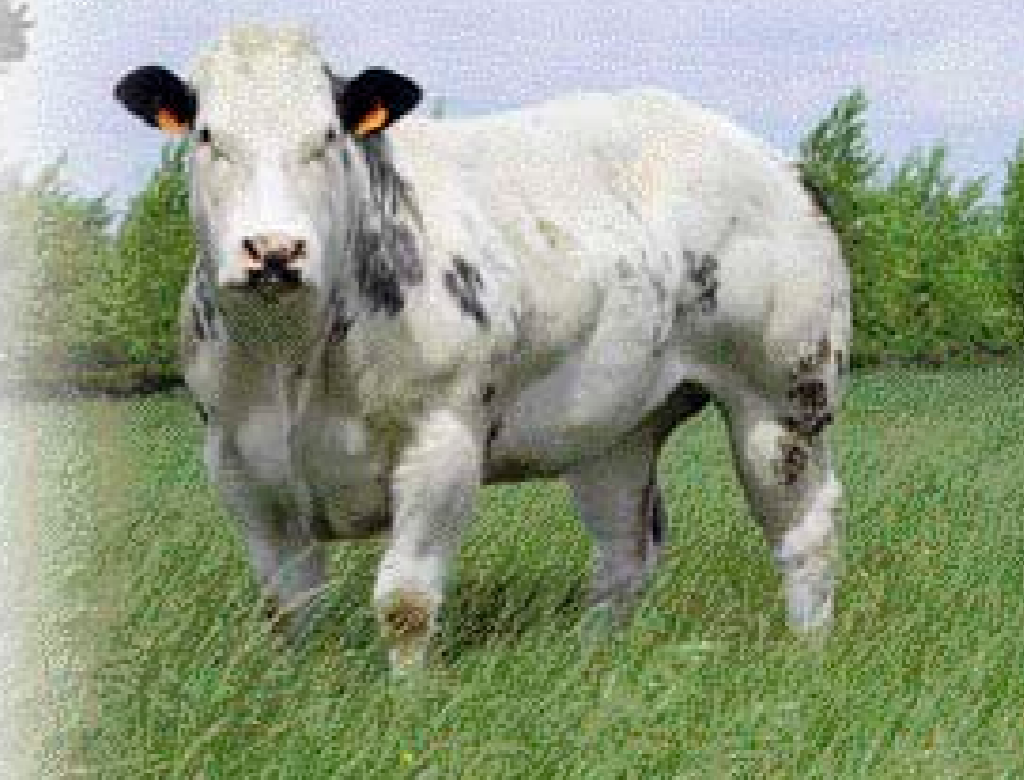
7876, een volle zus van ki-stier U2