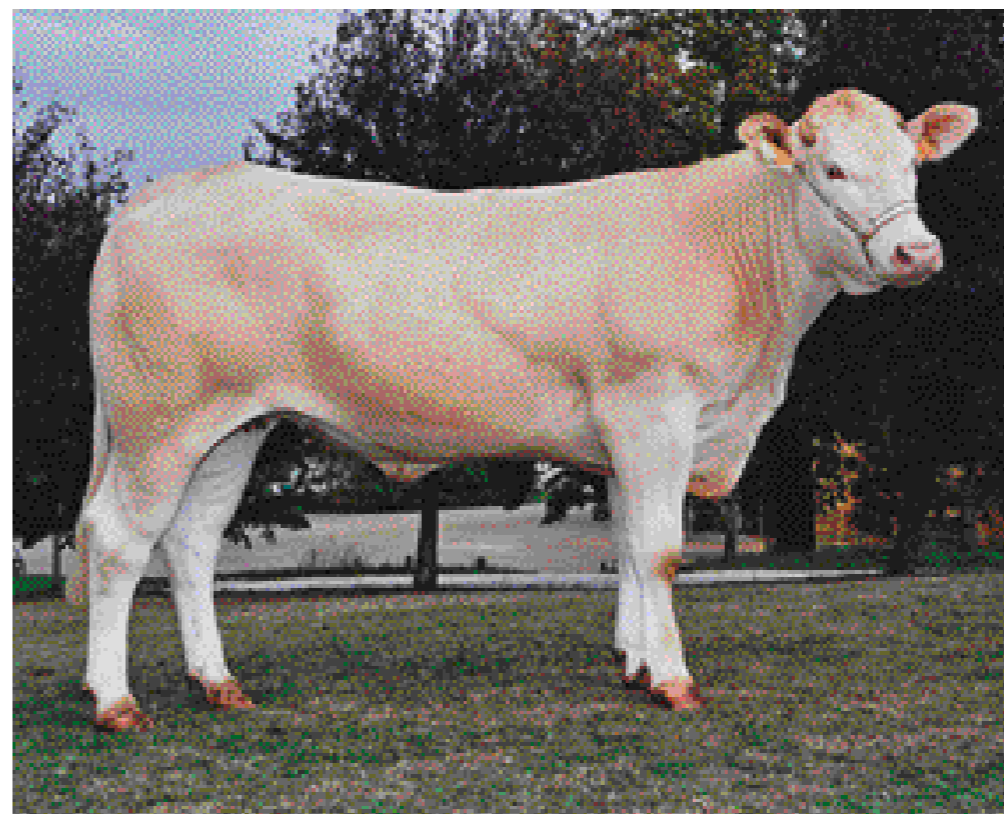
Unique, een van de best ontwikkelde Ringotdochters