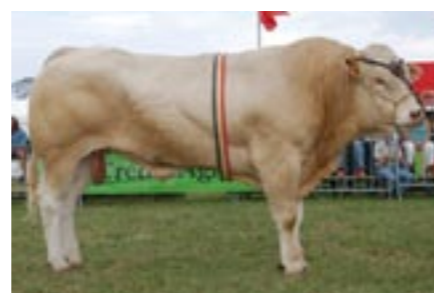
Uruguay (v. Ravissant), kampioen midden