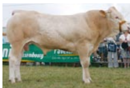
Walda (v. Leo), kampioen jonge stieren

hoewel hij deze dag niet in topvorm was, was Uruguay met zijn lengte en luxe bil niet te kloppen. De Ravissantzoon wist zijn titel van jeugdkampioen van vorig jaar op te waarden. De winst in de rubriek jongste stieren was