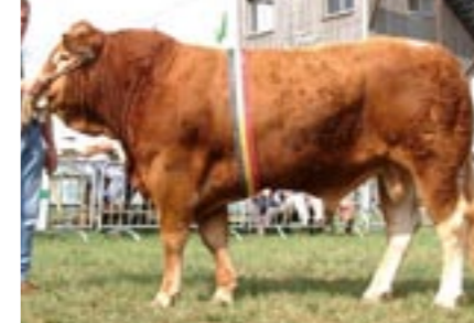
Vulcania (v. Prodige), kamp. jonge stieren