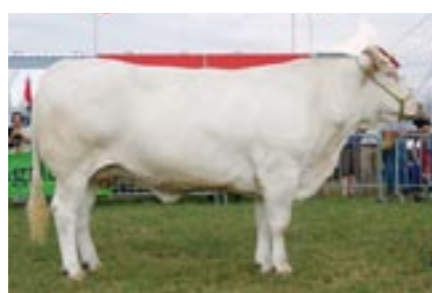
Romaine (v. Email), kampioene koeien