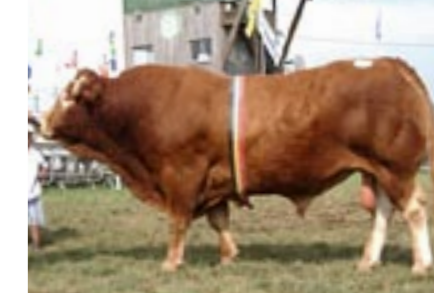
Senateur (v. Orly), kampioen oude stieren

Sûre met vloeiende overgangen tussen voor-, midden- en achterhand.