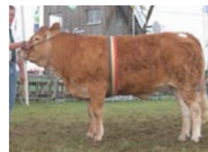
Venitienne (v. Prodige), kampioene vaarzen

Bij het kampioenschap bij de oudere stieren moest de grote Micmaczoon