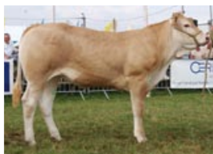
Amande (v. Tito), kampioene jonge vaarzen

De helft van de kampioenen was van origine Frans, zoals Romaine en Tudor . Ook het kampioenschap bij de middenklassestieren was voor een importproduct. Al-