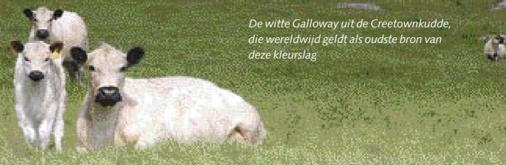
De witte Galloway uit de Creetownkudde, die wereldwijd geldt als oudste bron van deze kleurslag

dieren goed te fokken. Voor kortere koeien is hij minder geschikt.'