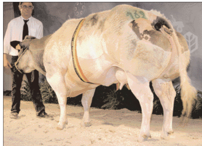
Giboulée de St. Fontaine kreeg vier stemmen op zeven