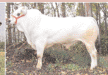
Manschots Otello (Marchigiana)