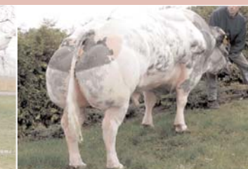
Tison de Wihogne (Belg. witblauw)