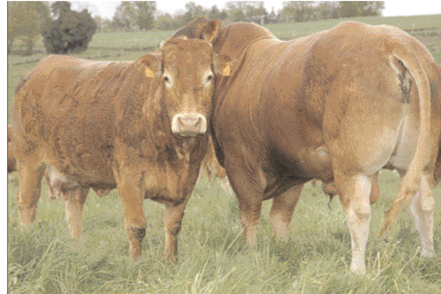
Romeo RR (Herbier x Concorde) in dekdienst bij Alrivie

De fokker gebruikt voor tachtig procent natuurlijk dekkende stieren en voor twintig procent kunstmatige inseminatie met sperma van eigen stieren. 'Kunstmatige inseminatie vindt enkel plaats bij vaarzen', verduidelijkt de fokker. 'Alle vaarzen worden daartoe tijdens de kersttijd gesynchroniseerd.' Nieuwe dekstieren worden getest op een vijftiental dieren, de helft vaarzen, de helft koeien. Schuilt hierin geen gevaar op het vlak van moeilijke kalvingen bij de vaarzen? 'Neen,' antwoordt de Fransman stellig, 'de vaarzen kalven hier relatief laat af, gemiddeld op drie jaar en vier maanden,