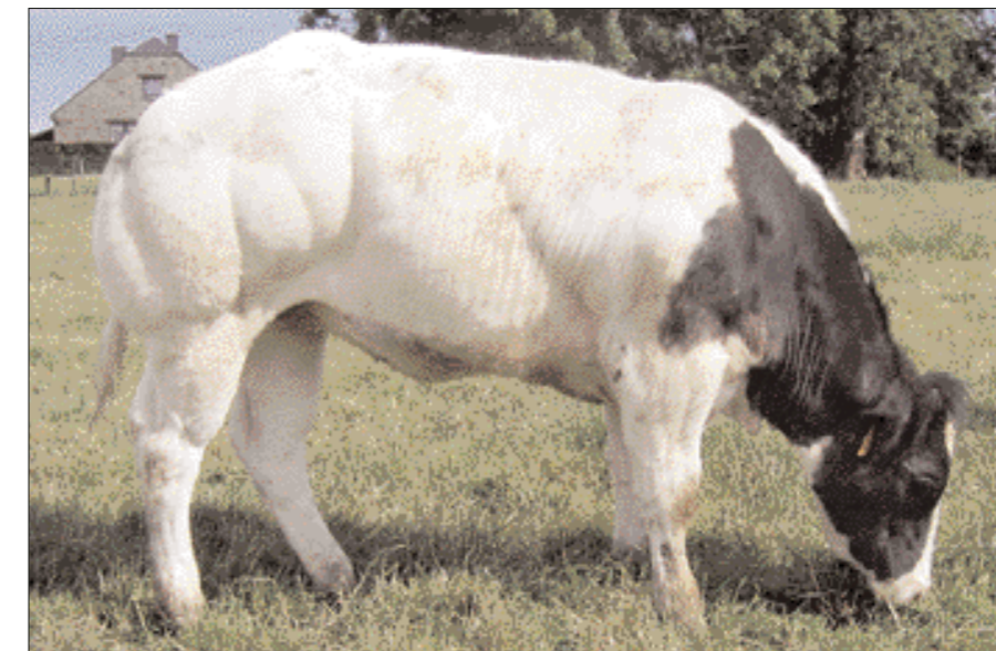
Door Martin gefokte Serumdochter (13 mnd.) uit een Osbornemoeder

Odieuse voert terug op Mascotte d'Anloy. Ook Mascotte kalfde viermaal af. Uit de paring met Brulot fokte Martin Nuageuse d'Anloy en met Bruegel Soubrette d'Anloy. Beide koeien werden destijds geselecteerd voor de nationale keuring te Brussel. Soubrette zelfs tweemaal. De Bruegeldochter, nu negen jaar oud en goed voor een exterieurscore van 91,5