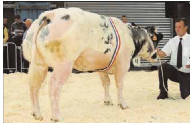
Gavina du Haut d'Arquennes, kampioene vrouwelijk 1-2 jaar