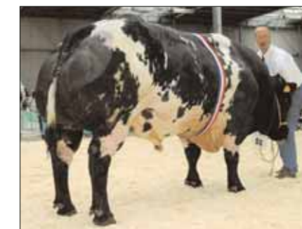
Bonaparte, kamp. stieren 2 jaar en ouder