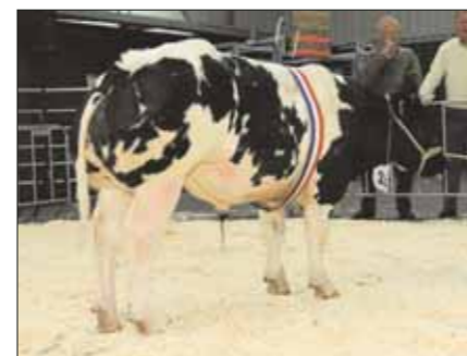
Kobra, kampioen stieren tot 1 jaar