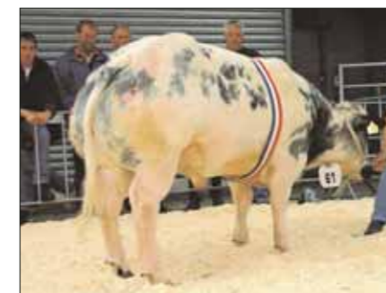
Nestor, kampioen stieren 1-2 jaar