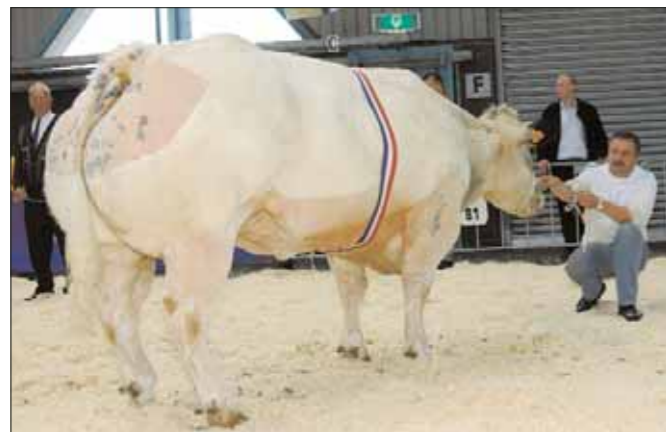
Campanule de Fooz, kampioene vrouwelijk 2 jaar en ouder