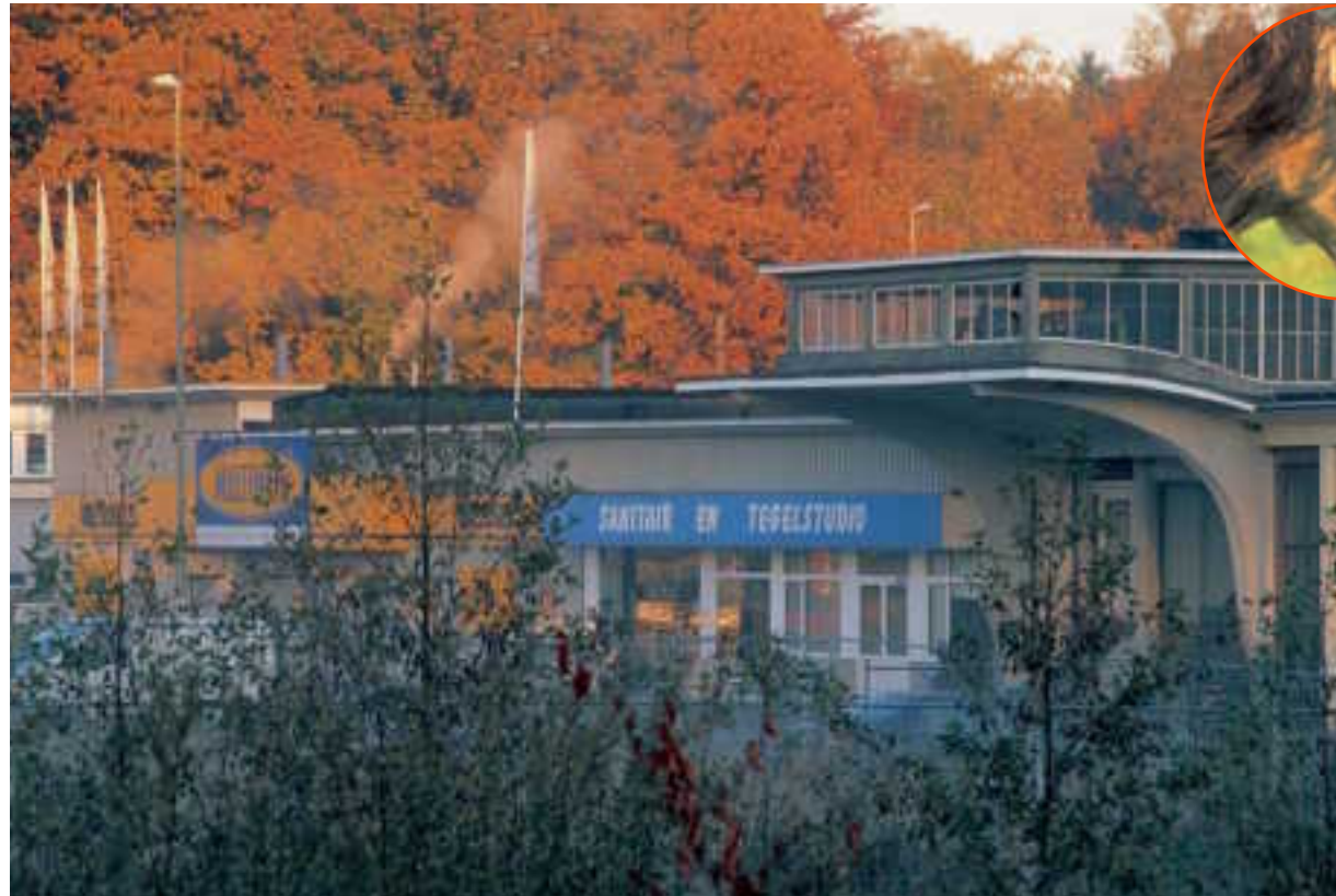
< Industrierrein Beukenlaan