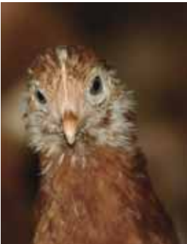
Een vol entschema heeft een keerzijde

Onderstaande suggesties zijn niet zozeer gebaseerd op wetenschappelijk onderzoek, maar zijn ervaringen uit de praktijk waarvan het succes met gezond verstand goed beredeneerd kan worden. Ze zijn allemaal gebaseerd op het idee dat (gecontroleerd) contact met onschuldige micro-organismen leidt tot een goede ontwikkeling van het immuunsysteem. Inmiddels is bekend dat het immuunsysteem bij kippen zich ontwikkelt in de eerste zes weken, dat is juist de periode waarin ze in een ontsmette omgeving gehouden worden. Juist voor deze periode of voor een periode waarin de gezondheid te wensen over laat, kunnen onderstaande suggesties ter harte genomen worden.