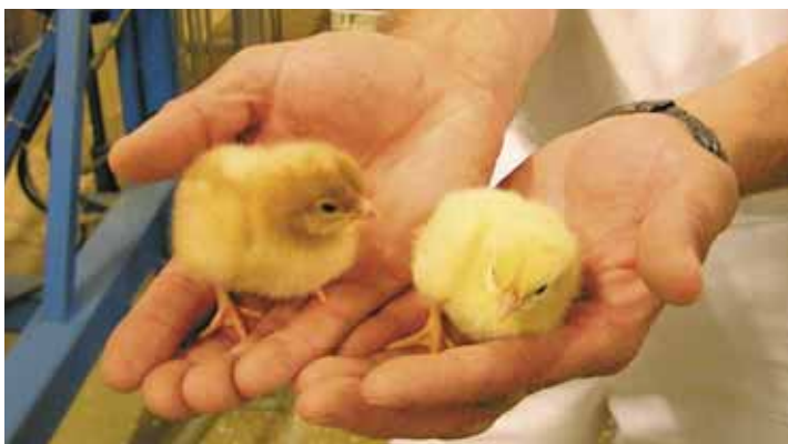
Kleursexen: het hennetje is bruin en het haantje is geel