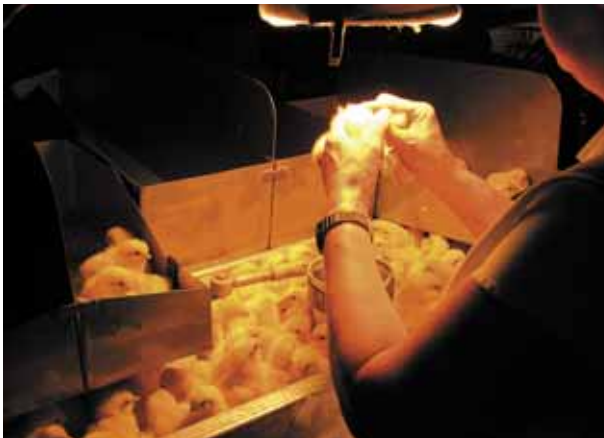
Cloacasexen is een vak apart

Voor het sexen zijn verschillende manieren, afhankelijk van de raskenmerken. De middelzware rassen hebben vaak verschillend gekleurde hanen en hennen, dan kan op basis van kleur gesext worden. Als haantjes en hennetjes dezelfde kleur hebben, wordt er naar het al dan niet aanwezig zijn van een minuscule puntje in de cloaca gekeken. Er zijn ook kippemerken waar het sexen gebeurt op basis van de veerlengte op de vleugels. Meteen na het sexen krijgen de hennetjes automatisch een IB-enting