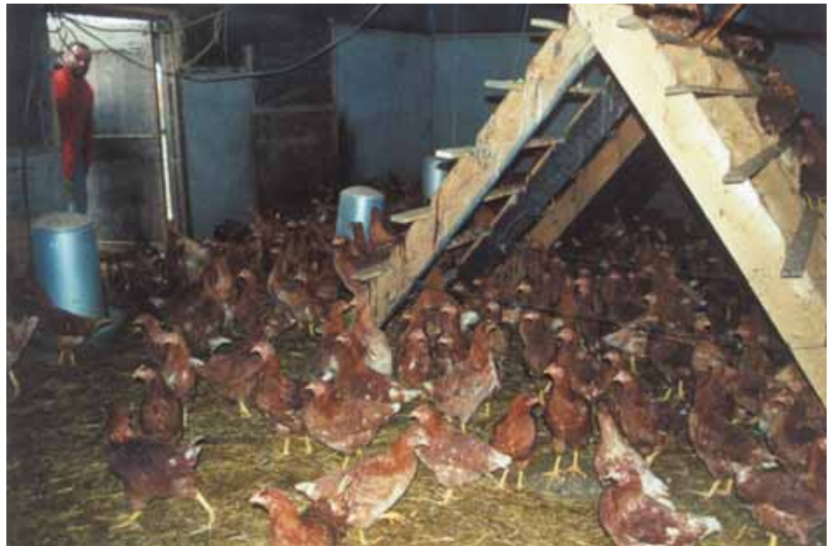
Opfok op het legbedrijf

Er zijn legbedrijven die zelf opfokken, zonder dat ze een speciaal opfokhok hebben. Er zijn dan wel meerdere hokken op het bedrijf aanwezig en tegen de tijd dat de kuikens komen, worden de oude hennen bij elkaar gezet om ruimte te maken. (Zie ook de bedrijfsrapportages Donkers en Coumans.) Is er wel een apart hok voor opfok dat een deel van de tijd leeg staat, dan kun je ook voor anderen opfokken. (Zie de bedrijfsrapportage van den Ham.)