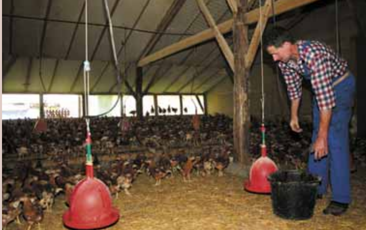
Stal met beun

kan de scharrelruimte vrijgegeven worden. Het is aan te bevelen om ook die eerste paar weken op het rooster zitstokken en zandbakken aan te bieden. Wanneer dieren de eerste weken op de beun gehouden worden en er zou geen strooisel zijn, dan is het risico op verenpikken hoger.