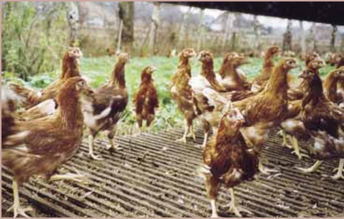
Uitloopopening, gezien van binnenuit. De hennen op deze foto zitten midden in de rui