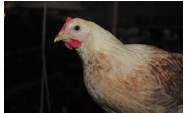
Een rode kam en lellen zijn een teken van goede gezondheid

Als er tekenen van verenpikkerij zijn, is het van belang om samen met de opfokker te kijken naar maatregelen die de kippen zoveel mogelijk afleiding geven.