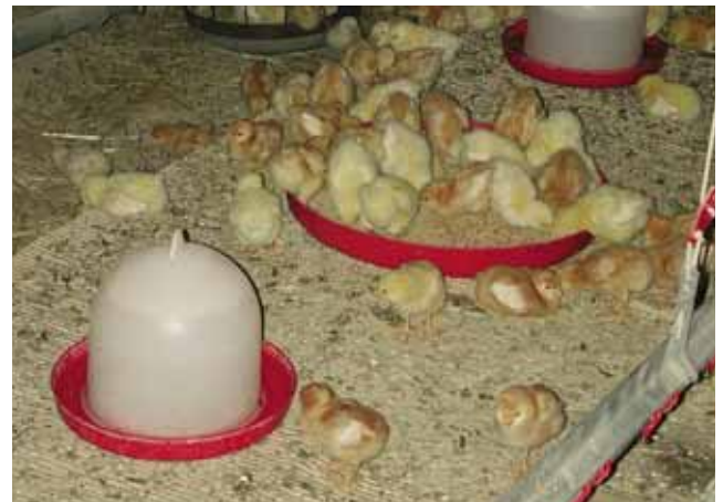
Beun bedekt met karton en stro