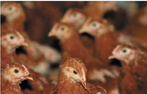
Een goed stalklimaat is van essentieel belang voor de weerstand tegen ziekten

Tenslotte valt er wat voor te zeggen om met betrekking tot wormen en coccidiose niet zozeer een nultolerantie na te streven, maar een gecontroleerde infectie toe te staan, zodat de dieren zelf immuniteit kunnen opbouwen.