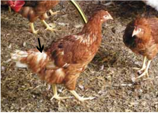
Als de kuikens er op 9 weken zo uit zien (zie pijl)...