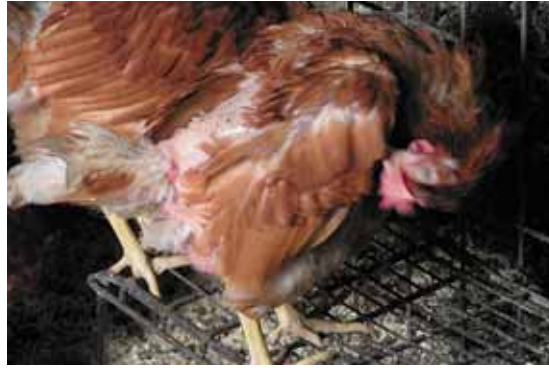
hebben ze op 32 weken flinke kale plekken

namelijk het eerst slachtoffer van agressie. Sommige merken hebben zoveel veren dat ze er zwaarder uitzien dan ze zijn. Het is goed om dan te voelen of ze lekker stevig zijn rond het borstbeen. Ook is het goed om te vragen naar de uitval en of er bijzonderheden voorgevallen zijn.