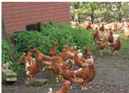
12-weekse hennen in de uitloop

Een andere pluimveehouder zag zijn opfokhennen in grotere aantallen naar buiten gaan toen hij er hanen uit één van zijn uitgelegde koppels bij zette.