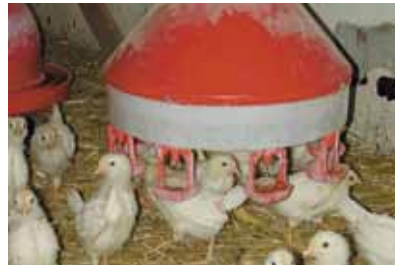
Ook onder deze drinkers schuilen de kuikens graag