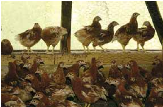
Er zijn bedrijven die jaarrond met veel daglicht opfokken