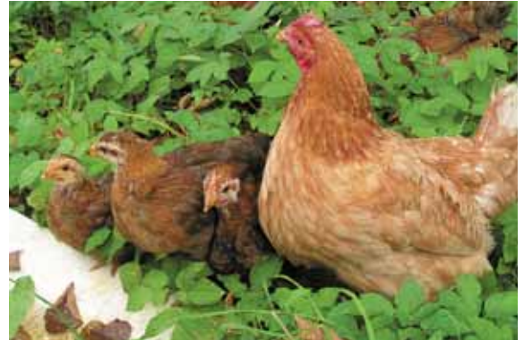
Kloek en kuikens drinken samen uit een goot

Engelse onderzoekers toonden aan dat een kloek andere geluiden maakt als ze haar kuikens lokt naar voer dat ze zelf lekker vindt dan naar voer dat ze minder lekker vindt. Als de kuikens toch nog het 'foute' voer oppikken, gaat ze zich extra uitsloven bij het voer dat zijzelf lekker vindt 54 .