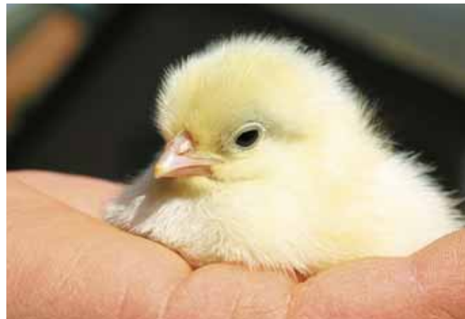
Een goede mens-dier relatie is goed voor gezondheid, welzijn en productie

Uit onderzoek aan kippen die al aan de leg zijn, blijkt dat de mate van angst voor mensen bepalend is voor hoe gestresst ze zijn, hoe hoog ze pieken en hoe lang de topproductie duurt 3,4,32 . Het is dus van belang om ze in de opfok al minder bang te laten zijn.