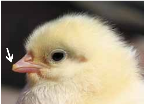
Bij dit kuiken is de eitand nog zichtbaar