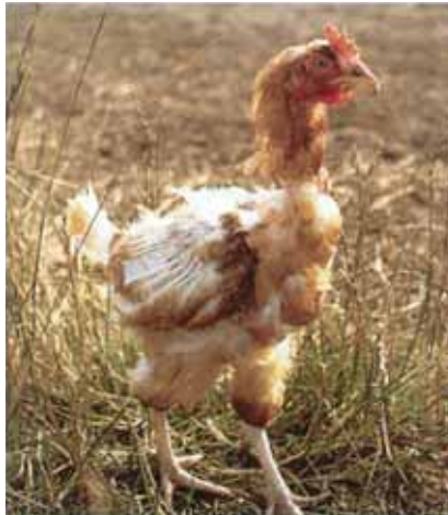
Slachtoffer van verenpikkerij