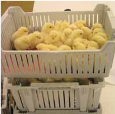
De kuikens gaan nog één dag de bewaarruimte in

(spray) en worden ze geteld (ook automatisch). Vervolgens krijgen ze handmatig een enting tegen Marek. Daarna gaan ze naar een opslagruimte, waar ze maximaal een dag 'bewaard' worden om bij te komen van de Marekenting en om de dooierzak te verteren. De dooierzak zit in hun buik en bevat nog een laatste restant vetten en eiwitten. Als kuikens te snel gaan eten, lopen ze het risico dat de dooierzak niet goed verteerd wordt en kunnen ze daar een ontsteking aan krijgen. In de bewaarruimte zitten ze met 50-100 kuikens in plastic bakjes. Als ze één dag oud zijn, gaan ze op transport naar de opfokbedrijven. Daar krijgen ze voor het eerst water en voer.