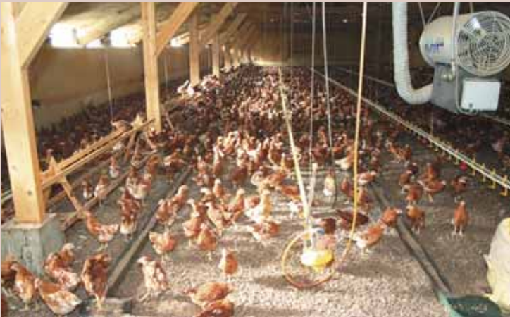
Grondstal met mini-zitstokken

Grondstallen (volledige strooiselvloer, dus een stal zonder beun) worden nogal eens gebruikt voor de warme opfok. De warme opfok is de eerste periode van zes weken, waarin de kuikens nog bijgewarmd moeten worden. Slechts een enkel bedrijf doet ook de koude opfok, de periode van 7 tot 17 weken, in een grondstal. In een grondstal kunnen het beste veel zitstokken en stobalen aangeboden worden om de dieren toch te leren omgaan met hoogteverschillen.