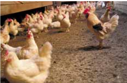
Hennen die tijdens de opfok niet verenpikken, kunnen later veel beter tegen een stootje. Op dit legbedrijf is geen strooisel in de scharrelruimte en toch wordt er niet geverenpikt

De eerste 2-3 weken bestaat het verenkleed nog uit dons. Met een week of vijf is het verenkleed compleet. Tot die tijd kun je symptomen van verenpikken alleen zien als het echt heel erg is (bijvoorbeeld bloederige staartjes). Met 8-9 weken volgt een onvolledige rui, waarbij de staartveren nog blijven zitten. Vanaf 13 weken tot 18, 19 weken ondergaan de dieren een volledige rui, waarbij de staartveren meeruien. In de periodes van rui kan het verenkleed er slordig uitzien, wat het beoordelen van pikkerij soms moeilijk kan maken. Het duidelijkste kenmerk van schade door verenpikken is echter schade rond de stuitklier, welke zich bevindt onderaan de rug, op de overgang naar de staart. Het vanwege de rui slecht in de veren zitten, kan overigens ook pikkerij uitlokken, dus het is goed de dieren dan extra goed in de gaten te houden.