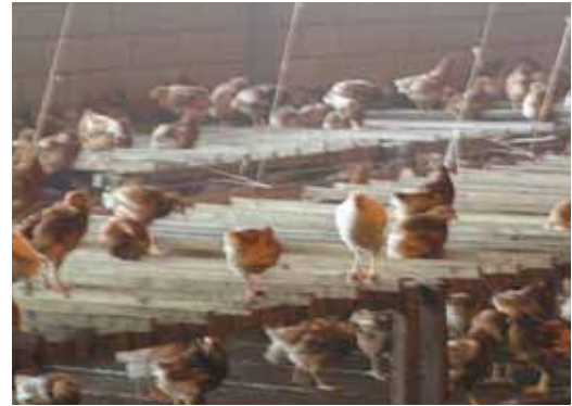
Verhoogde zitstokken boven de beun

weken in de legstal, dan is het te laat en worden er drie maal zoveel grondeieren gelegd en is er twee maal zoveel uitval door cloacakannibalisme 31 . In het begin worden de zitstokken alleen overdag gebruikt, maar vanaf een week of tien wordt er ook 's nachts op geslapen.