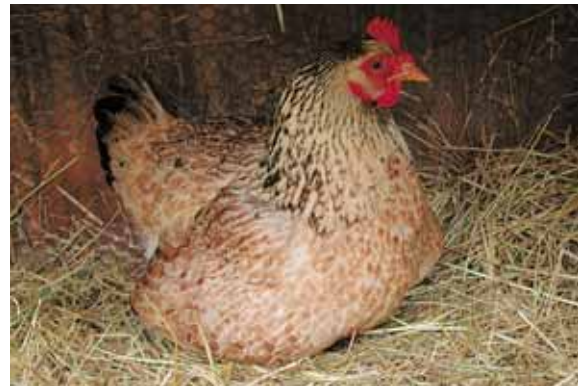
Onder natuurlijke omstandigheden gaat, vanuit het kuiken gezien, warmte altijd samen met duisternis