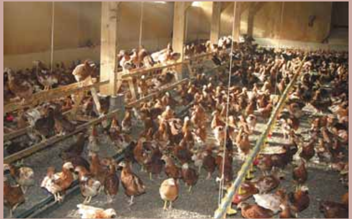
De grondstal voor warme opfok

In de warme opfokstal passen 8000 kuikens, ze zitten dan met 24 per m 2 . Het is een grondstal, dus als de eendagskuikens komen, is de volledige vloer bedekt met houtkrullen. De wanden zijn lichtgeel gespoten met isolatieschuim en er komt redelijk wat daglicht binnen. Met name de houtkrullen en het daglicht voorkomen stress. Als de kuikens nog in het dons zitten, hangt er een ware babykamersfeer. Voor de eerste twee weken zijn er kartonnen voerplaten en kleine drinktorentjes, die met de hand bijgevuld worden. Daarna wordt er gegeten en gedronken uit de voerketting en drinknippels met lekschaaltjes en drinkcups met open water. Ook zijn er meteen vanaf het begin al zelfgetimmerde, kleine A-ruiter-tjes (zitstokken) beschikbaar. 'Vanaf een dag of tien maken ze daar gebruik van, de witte merken sneller dan de bruine.' Een grondstal als de zijne heeft één nadeel: de kans op coccidiose is groter. Door ervaring wijzer geworden, krijgen de kuikens in de warme opfok daarom twee keer een Baycox-behandeling. 'Met een dergelijke behandeling wordt de infectiedruk verminderd. Niet helemaal tot nul, dus ze kunnen er nog wel afweer tegen opbouwen. Anders zouden ze er later alsnog problemen mee krijgen.'