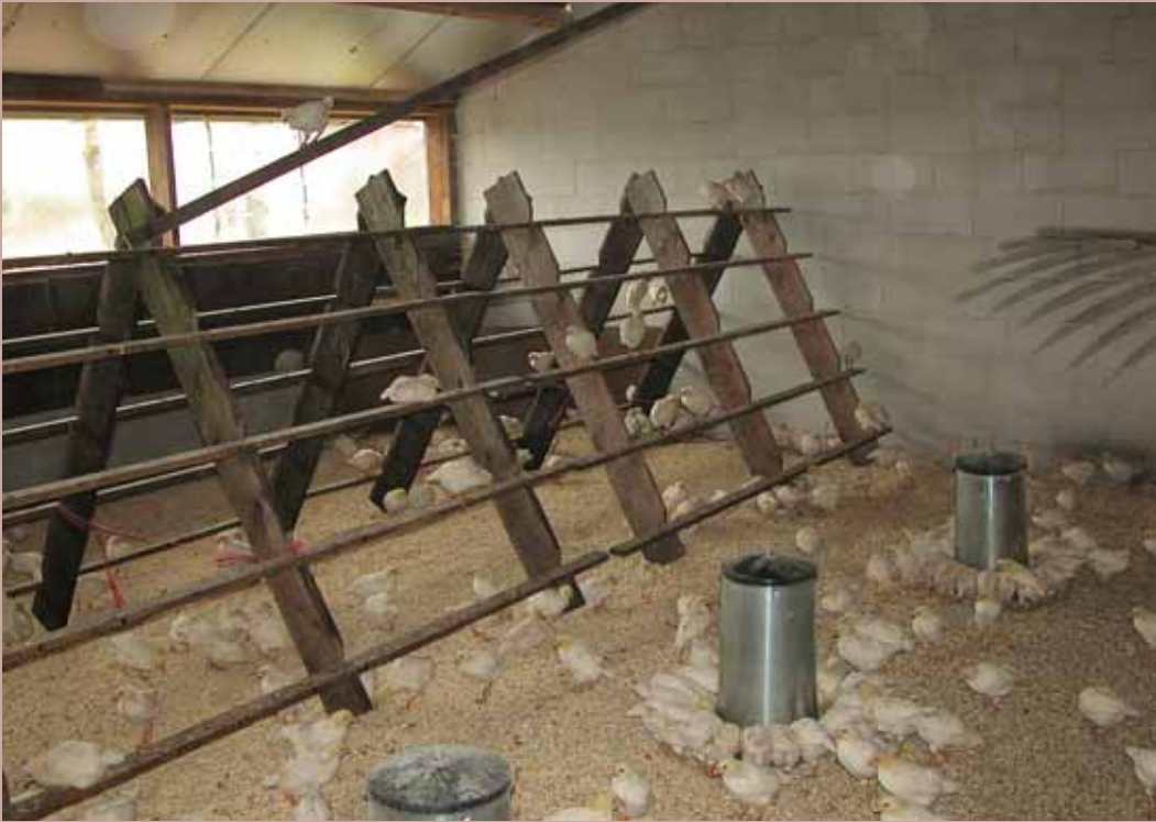
In deze stal vindt de gehele opfok plaats

Gied en Els Donkers behoren met 1500 legkippen weliswaar niet tot de grote bedrijven, maar door de campagne 'Adopteer een kip' wel tot de bekendste. Eerst fokte Gied de kuikens zelf op vanaf zes weken, dit jaar vanaf de eerste dag. De kippen gaan twee legrondes mee, tussendoor wordt geruid. Er zijn twee hokken, de ene twee keer zo groot als de andere. Na het ruien zitten alle kippen in het grote hok en wordt het kleine hok gebruikt voor opfok.