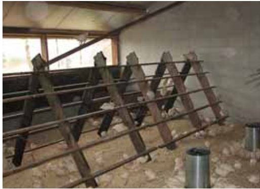
Daglicht en zitstokken in een grondstal