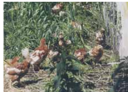
De uitloop van deze 5-weekse hennen is ingezaaid met graan

de ketting eten en ze niet meer op het rooster zitten, dagelijks graan te strooien in het strooisel. Een goed strooischema is om tijdens de warm opfok dagelijks 3 gram per kuiken te strooien en op te bouwen naar 9 gram op een leeftijd van 16 weken. Overigens moet het graan tot een week of acht gebroken zijn, omdat het anders te grof is.