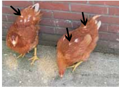
De witte onderveertjes op de rug bij deze 16-weekse hennen zijn een subtiel teken van verenpikkerij