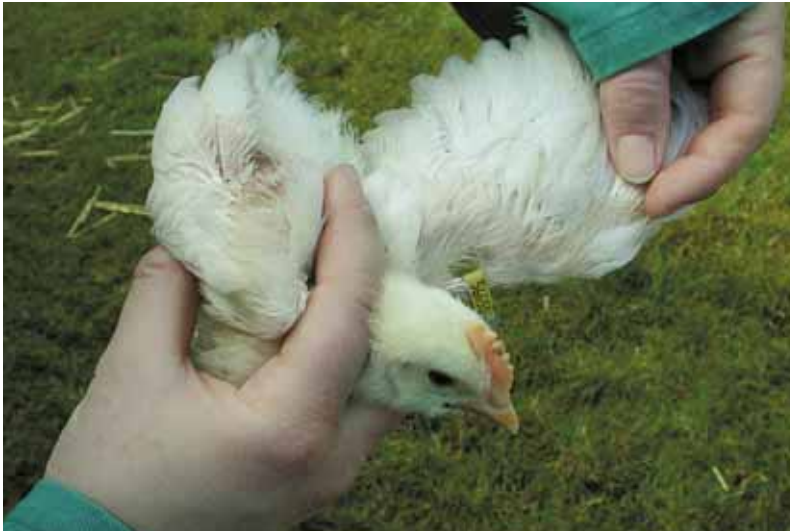
Verenpikkerij begint altijd op de overgang van rug naar staart

hen afleveren. 'Als de klant tevreden is, heb je er als opfokker ook meer schik van' 7 . Ook horen ze graag terug hoe een koppel het uiteindelijk doet op het legbedrijf, zodat ze eventueel dingen kunnen aanpassen bij volgende koppels 12 .