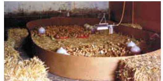
Een kuikenring voorkomt dat de kuikens elkaar doodrukken in de hoeken