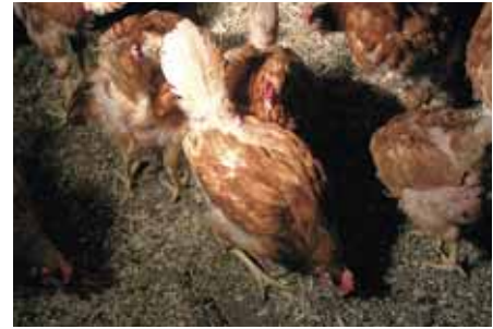
Ernstige verenpikschade bij 32-weekse hennen. Aan het eind van de opfok zagen ze eruit zoals op de linkerfoto

gende legpluimveehouder de koppel bijna altijd beoordeelt als zijnde 'goed in de veren' en 'geen last van pikkerij'. Echter, als op de leeftijd van 16 weken bij 20% van de kippen enkele onderveertjes zichtbaar zijn, dan heeft het merendeel van de koppel op 30 weken flinke kale plekken.