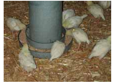
Jonge kuikens op stro

Opfok op strooisel vanaf de eerste dag vormt samen met strooigraan verstrekken de belangrijkste factor om grondgericht pikgedrag aan te leren. Hennen die hun pikgedrag op de grond richten, verenpikken minder. Strooisel kan de interesse van de dieren het best vasthouden wanneer er ook iets in te vinden is. Aanbevolen wordt daarom om vanaf het moment dat de kuikens uit