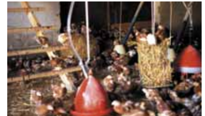
Strobalen en korven met ruwvoer zorgen voor afleiding

Zaagsel en stro zijn niet geschikt voor het nemen van stofbadend, terwijl kuikens vanaf één week al kunnen stofbadend. Behalve zaagsel moet dus ook zand aangeboden worden, het liefst in bakken. Dit kan ook op de beun, als de kuikens daar de eerste weken opgesloten zitten.