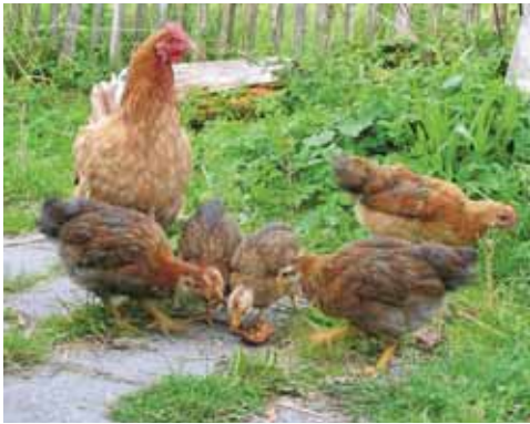
Door middel van voerropen lokt de kloek de kuikens naar voedsel