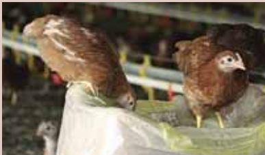
Kuikens zitten op een zak houtkrullen

Het is belangrijk de kuikens zoveel mogelijk afleiding aan te bieden. Dit kan in de vorm van verhoogde zitstokken, strobalen, zandbakken, strooigraan, korven met ruwvoer, broden en pikstenen. Bij de keuze van strooisel bij erg jonge kuikens dient o.a. rekening gehouden te worden met de hygiëne. Houtkrullen zijn altijd verpakt en dus schoon, terwijl stro dat buiten bewaard is, ziektekiemen (salmonella, mycotoxinen) kan bevatten. Ook raak je de mest makkelijker kwijt als het met houtkrullen vermengd is i.p.v. met stro 70 .