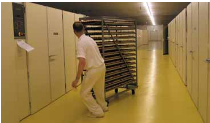
Aan weerszijden van deze gang bevinden zich de voorbroeders

Na 21 dagen broeden komen de kuikens uit het ei. De eerste 18 dagen brengen de broedeieren door in de zogenaamde 'voorbroedkasten'. De temperatuur is er 37,8°C. De eerste 8-9 dagen wordt bijgewarmd, maar daarna gaan de embryo's zelf warmte produceren. Zoveel dat bij dergelijke grote aantallen embryo's in een relatief kleine ruimte er in de voorbroeders zelfs gekoeld moet worden. Ook gaan ze