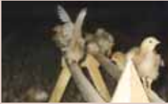
Met 2 weken fladdert een kuiken al omhoog

Wilde kippen in de natuur zitten weliswaar de eerste zes weken overdag af en toe op een tak, maar ze slapen 's nachts nog op de grond. Dit geldt ook voor opfokhennen. Zitstokken in de warme opfok worden vanaf een week of 2-3 overdag gebruikt en pas vanaf een week of 10 ook 's nachts.