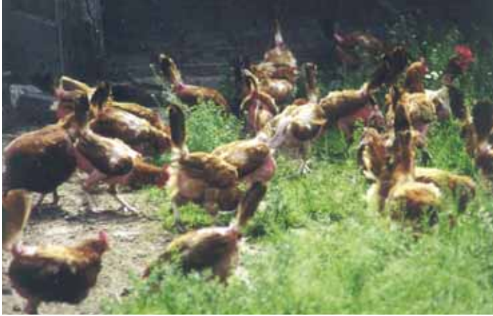
Verenpikken is één van de grootste welzijnsproblemen in de alternatieve pluimveehouderij