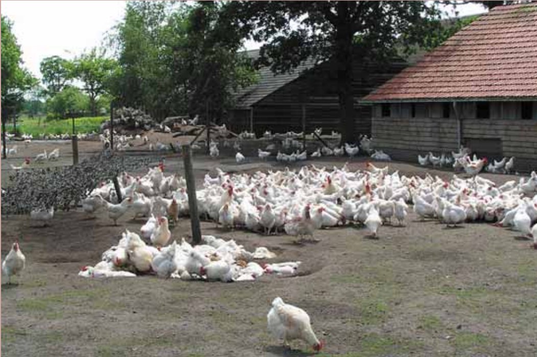
Gied en Els Donkers hebben twee schuren waar respectievelijk 500 en 1000 kippen in gehouden worden

12-13 maanden, het is dan weer maart, worden ze geruid. Dat duurt 6 weken. Daarna volgt de tweede legronde van 9-10 maanden. Tijdens de rui worden de mindere kippen eruit geselecteerd en de kippen uit het kleine hok verhuizen dan ook naar de grote schuur (voor aanvang van de rui). In de kleine schuur kan dan na schoonmaken en een tijdje leegstand begonnen worden met de nieuwe opfok. En zo is de cirkel weer rond.