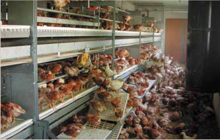
Volière met 16-weekse hennen