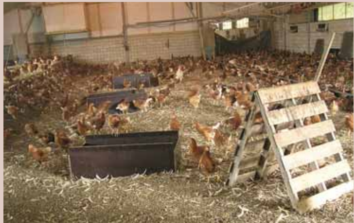
Zandbakken in de stal

aan de kleur 43 . De eerste 2-5 dagen na uitkomen kunnen er nog vreemde kuikens bijgezet worden, hoewel die wel van dezelfde kleur moeten zijn, maar daarna worden alle vreemde kuikens weg- of zelfs dood gepikt. Kuikens en kloeken onderhouden tijdens het voedsel zoeken contact door middel van piepgeluiden. Gaat het regenen, dan biedt de kloek zichzelf aan om onder te schuilen. In de andere gevallen (om afkoeling te voorkomen) nemen de kuikens het initiatief: ze springen aan de voorkant tegen de kloek aan om aan te geven dat ze 'door de knieën' moet 72 . In de loop van de dag worden perioden van activiteit (lopen en eten zoeken) regelmatig afgewisseld met rusten onder de kloek. De eerste weken slapen kuikens onder de kloek op de grond. Pas na een week of vier nemen wilde kloeken hun kuikens voor de dag mee de boom in 50 en pas vanaf een week of zes ook voor de nacht. Dat is kort voordat ze 'gespeend' worden 72,73 . Na een week of