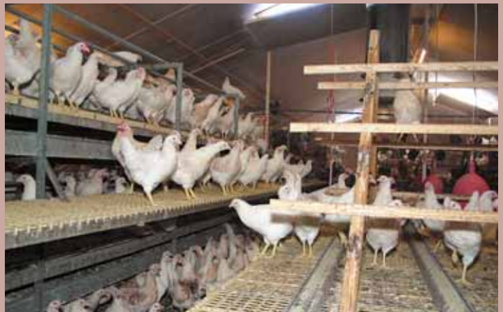
De stal voor koude opfok, met middenin een beun en aan weerszijden étages