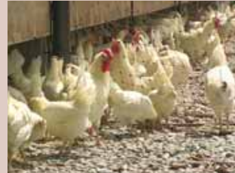
De ouderdieren van biologische leghennen lopen in Zwitserland buiten

In Zwitserland worden 200.000 legkippen en 8000 ouderdieren op biologische wijze gehouden. Eén van de beweegredenen voor biologische in plaats van gangbare ouderdieren, is dat een kuiken van biologische ouders qua maternale antilichamen en gedrag beter voorbereid is op de biologische houderij. Immers, ze krijgen via de dooier en het eiwit antilichamen en hormonen mee van de moeder. De hoeveelheid hangt af van de leefomstandigheden van de ouders. Biologische ouderdieren worden op dezelfde wijze gehouden als biologische leghennen. De groepsgrootte is maximaal 500 dieren, met hooguit vier groepen per bedrijf. Ook hier bestaat 10% van de dieren uit hanen. De bezetting is maximaal 5 dieren per vierkante meter, éénderde van het vloeroppervlak is scharrelruimte en er zijn legnesten en zitstokken beschikbaar. De uitloop bedraagt 5 vierkante meter per dier. Deze bestaat uit een wintergarten en een 'echte' vrije uitloop met gras en struiken. De belangrijkste verschillen met de Nederlandse situatie zijn de uitloop naar buiten, de groepsgrootte en de bezetting. Per ronde worden mest en eieren drie keer onderzocht op salmonella. De dieren worden niet ontwormd.