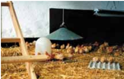
Zitstokken, eiertrays en een schuilplek in de buurt van de warmtebron

Warmtestralers die weinig zichtbaar licht uitstralen, met daaromheen een soort schuilplaatsen voldoen