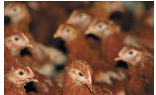
In grote groepen wordt minder agressie gezien dan in kleine groepen waar kippen elkaar individueel kennen