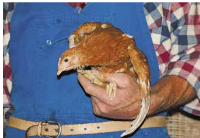
Regelmatig bij de kippen zijn en af en toe een kip oppakken maakt ze minder schuw