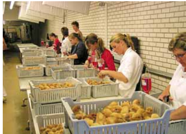
Op de broederij krijgen alle kuikens een merk-enting