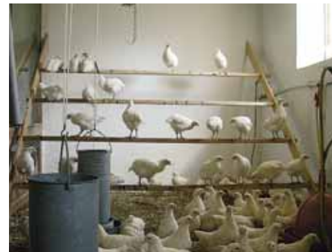
In een stal met daglicht zien de kuikens hun omgeving anders dan met alleen kunstlicht