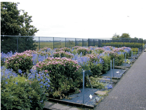
Onderzoek GNO's tegen ziekten in vaste planten

Er is een groot aanbod van GNO's. De meeste van deze middelen zijn niet in Nederland geregistreerd als gewasbeschermingsmiddel. (Zie rapport Inventarisatie GNO's, uitgevoerd door PPO Glastuinbouw, in opdracht van het project Genoeg)