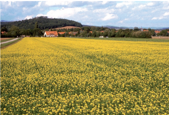
Zwischenfruchtanbau mit Senf, Bestand im Herbst

Die Vorfrüchte beeinflussen auch die Bodenstruktur. Körnerleguminosen sind geeignet, den Boden tiefreichend zu lockern. Hohe Mengen an Ernterückständen können die Zuckerrübenaussaat behindern und durch Mattenbildung zu Beinigkeit der Zuckerrüben