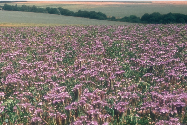
Phaceliaanbau zur schnellen Unterdrückung von Ackerunkräutern

▶ Buchweizen eignet sich durch seine schnelle Jugendentwicklung zur kurzfristigen Begrünung zwischen zwei Winterungen und weniger vor einer Sommerung. Zur Vermeidung von Durchwuchs muss das Aussamen unbedingt verhindert werden.