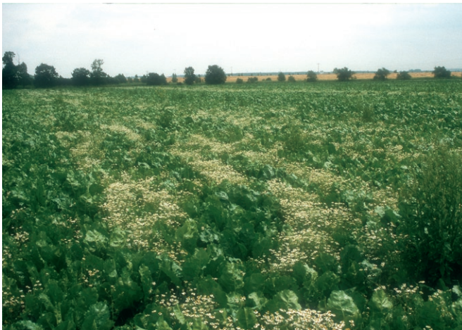
Verunkrautung eines Öko-Zuckerrübenbestandes, vorwiegend Kamille

Grundsätzlich muss darauf geachtet werden, dass die Maschinenhacke die gleiche oder halbe bzw. ein Drittel der Arbeitsbreite der Sämaschine aufweist, da es sonst zum Verlust ganzer Reihen im Überlappungsbereich kommen kann. Aufgrund der Empfindlichkeit der jungen Rübenpflanzen gegenüber Verschütten und Verletzungen kann zu diesem Zeitpunkt noch keine maschinelle Regulierung in der Rübenreihe durchgeführt werden.