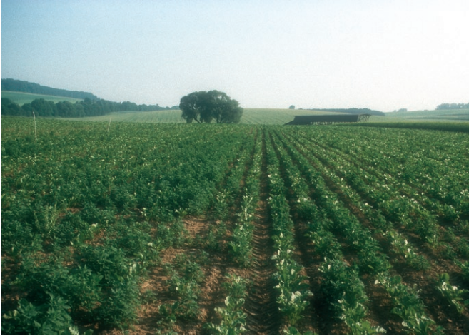
Einfluss der Maschinenhacke auf die Verunkrautung, links ohne und rechts mit Maschinenhacke