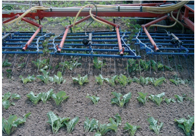
Striegeln der Zuckerrüben im BBCH-Stadium 18

Ab Sichtbarwerden der Zuckerrübenzeilen (BBCH 10) kann die erste Un-