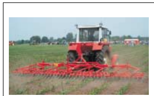
Fig. 4. 25% minder bewerkingen door latere zaai maïs