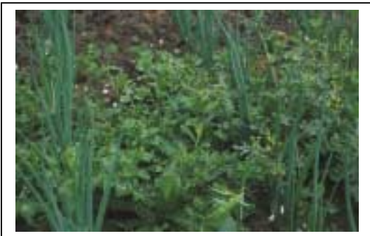
Fig. 2 Ontsnapt onkruid produceert duizenden zaden