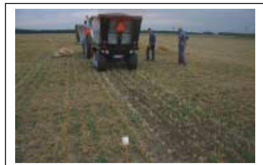
Fig. 3. Opzuigen van tarwekaf en korrel in graszaad