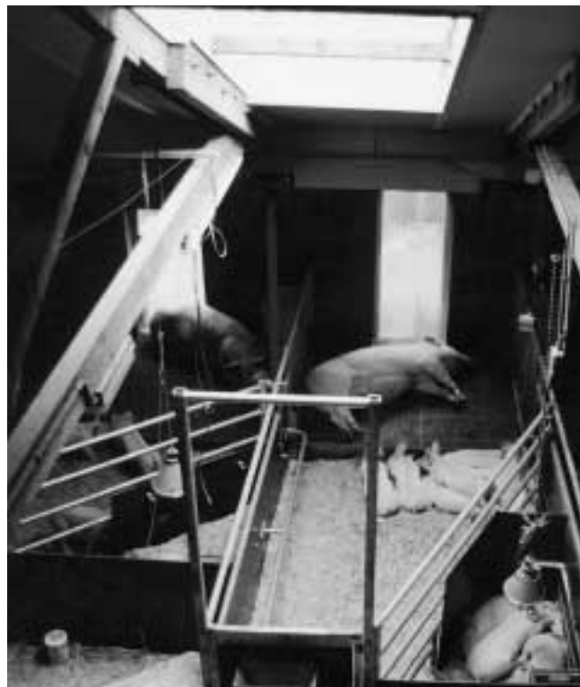
Twee hokken met 7,5 m 2 dichte vloer binnen en roostervloer in de buitenruimte achter de flappen

afhankelijk van ontwikkelingen in de markt. De biologische varkenshouderij zal voor een deel van de Nederlandse varkensbedrijven zeker toekomst hebben. Dit zijn met name de bedrijven die niet kunnen of willen meedoen aan de alsmear voortschrijdende schaalvergroting. Een gesloten biologisch gezinsbedrijf zal ongeveer 100 zeugen kunnen houden. Op een gangbaar bedrijf is dit 200 tot 250. Het Praktijkonderzoek Veehouderij bouwt op dit moment een nieuwe accommodatie voor biologische varkens in Raalte en is ook deelnemer in het landelijke demonstratieproject "Biovar". 🏠