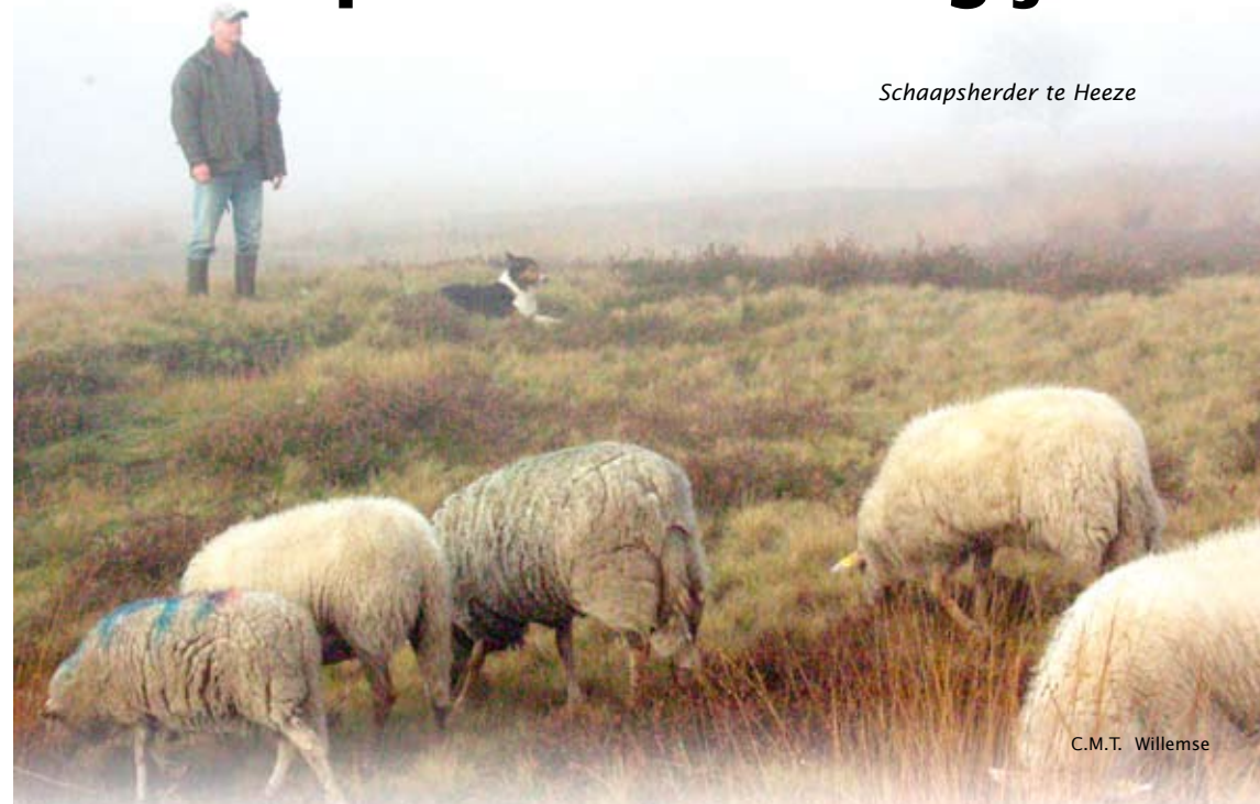
Schaapsherder te Heeze