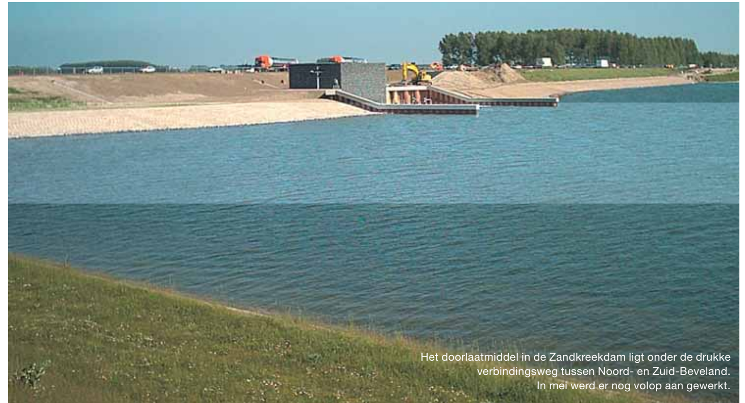
Het doorlaatmiddel in de Zandkreekdijk ligt onder de drukke verbindingsweg tussen Noord- en Zuid-Beveland. In mei werd er nog volop aan gewerkt.

besluiten of een vast peil dan nog wel nodig is. Dijkgraaf Gosselaar: 'Deze uitspraak komt wel overeen met de gedachten die aanvankelijk ook in de stuurgroep leefden. Als ik zie hoe lang er door de geleerden gestoeid wordt over de gevolgen van dit soort ingrepen, dan is een paar jaar monitoren zeker niet verkeerd. Intussen kan de provincie sparen voor de aanpassingswerken en het Rijk voor de afkoopsom voor de overdracht...' En met die laatste opmerking komen we midden in Brokx-nat terecht.