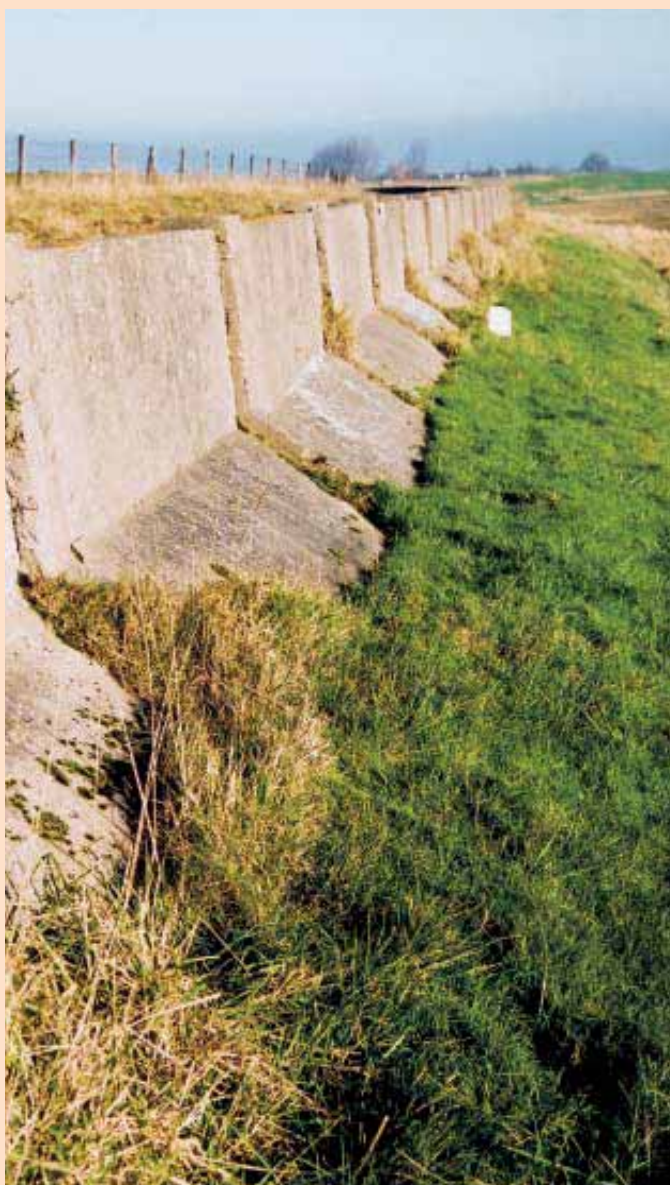
Een deel van de muraltmuur bij Ouwerkerk.

elkaar gebouwd. De schuur draaide los van ons huis en we kregen aan de noordkant een groot gapend gat in ons huis. De golven rolden vanaf dat moment de zolder op, tweeënhalve meter hoog. Het was niet meer te harden. We hadden ook gezien dat iedereen op zijn dak terecht kwam. Op dat moment zijn wij door de dakkapel het dak opgegaan. De meeste mensen waren al weg. Hier en daar hoorde je - het was inmiddels donker geworden - nog roepen. In de buurt zaten ook nog een aantal mensen op het dak. Tegen half acht stortte er nog een dak in. We hoorden die mensen roepen en dachten: 'dan hebben ze tenminste toch overleefd!' Later bleek dat er maar één overlevende was van die hele groep. Die is heen en weer gedreven tussen de dijken bij eb en vloed. Een jonge vent van rond de twintig, wetende dat hij alleen overgebleven was. Hij heeft het niet meer aangekund. Dat wisten wij op dat moment allemaal niet. We zaten er op te wachten dat ons dak in zou storten want bij elke golf voelde je het wiebelen en draaien. Na half acht ging het water zakken en trok het zich terug. Ik zag de kopjes van de dakpalen er weer door komen. Mijn vader zei dat we redelijk veilig zaten dus we bleven hier.