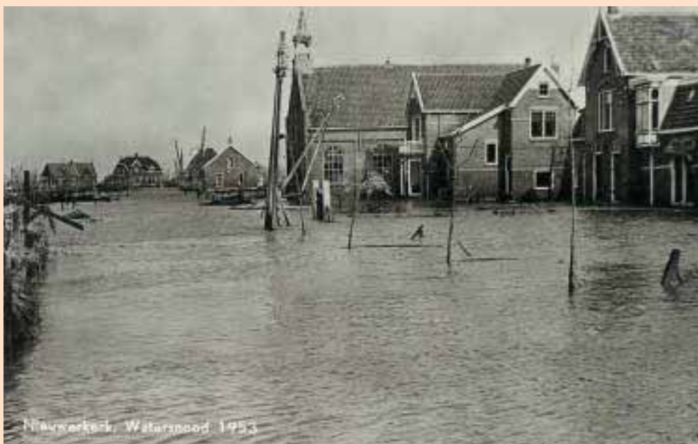
Rechts op de Ansichtkaart het huis van de familie Flikweert

Wij zijn vervolgens de zolder opgegaan. Wij wisten niet dat in Zierikzee het water 's morgens in alle vroegte al over de kade-muur gelopen was. Waren verstoken van alle nieuws. Een uur of zeven 's ochtends zijn we de zolder opgegaan. Om elf uur zagen we het water een beetje stabiliseren op anderhalf á twee meter hoogte en daarna was het stil. Na elven ging het weer stijgen. We zagen het telkens hoger komen. We wisten niet dat inmiddels bij Ouwerkerk een heel groot gat was ontstaan. Met die vloed is dat gewoon uitgeschuurd. Uur na uur steeg het water en tegen een uur of drie 's middags, zagen we de eerste vlotjes langskomen. Zo'n vlot bestond uit het dak van het huis waar de mensen de pannen vanaf hadden gegooid zodat het