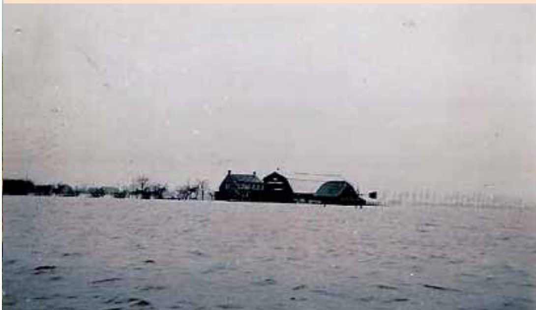
De boerderij van Wijne kort na de ramp

Munters: 'Nu denken we weer dat we klaar zijn. Maar als de omstandigheden van toen zich weer zouden voordoen, steken wij onze handen niet in het vuur voor een goede afloop. De natuur blijft onberekenbaar!'