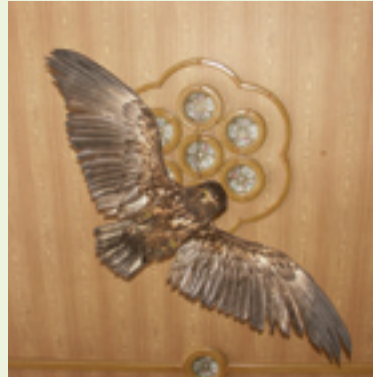
◀ Een zeearend scheert langs het plafond met borden

Voor aanmelding en meer informatie kunt u terecht bij de website van de vereniging: www.knbv.nl