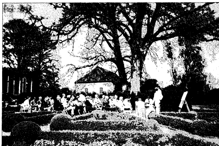
■ Bosgroep Gelderland bespreekt toepassing Natuurschoonwet op landgoed Beekvliet.