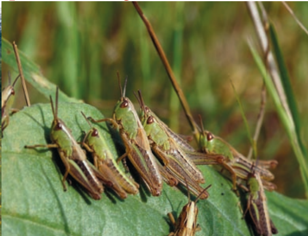
Zomer 2004: miljoenen sprinkhanen bevolken de zomerruigtes in begrazingsgebieden.

uit te breiden dankzij de combinatie van meer rivierdynamiek en natuurlijke begrazing in de Gelderse Poort.