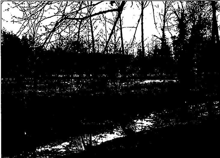
Kees de Lange: hele stroomgebieden bekijken is het vak van de bosbouwer

gen zijn. Niet altijd luisteren naar de gevestigde orde, maar af en toe eens flink prikkelen en tegen de schenen schoppen. De ongekuiste waarheid, dan wordt het blad gelezen.