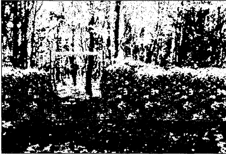
Een 2 e prijs voor het ontwerp "Eenzaamheid", een omheind bos waar je alleen kunt zijn

Bos dat wordt gedomineerd door krachtige begroeide sculpturen. De groene groeiende vormen zijn steeds verwant aan elkaar door hoogte, vorm en volume. Een open, met gras begroeide wandelroute slingert door deze 'beeldentuin'.