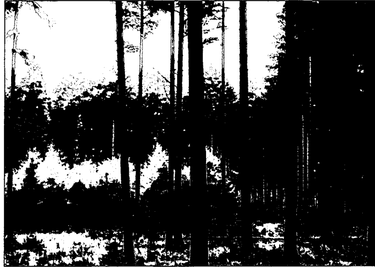
Grotere gaten geven ruimte aan lichtboomsoorten, maar waar ligt de grens tussen boomsgewijze en vlaktegewijze oogst

beheer van de opstand (kappen en verjongen door aanplant of doorgaan met de bestaande opstand).