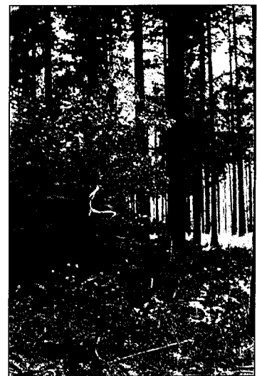
Bescherming tegen wild is voor diverse loofboomsoorten nuttig. Maar is het ook nodig en wegen de voordelen op tegen de kosten?

geconfronteerd werd als: hoe krijg ik toch opbrengsten en hoe kan ik met mijn bos verder zonder grote investeringen. Pro Silva heeft waarschijnlijk veel van deze vragen samen met de beheerders kunnen laten zien bij de ex-