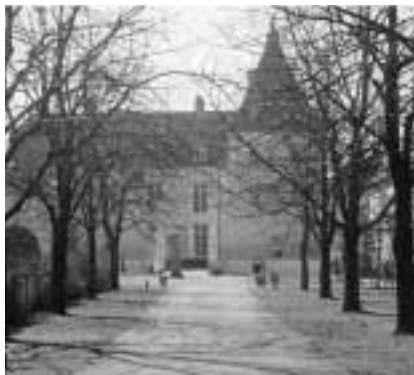
Buitenplaats Rijckholt te Groensveld in 2000.