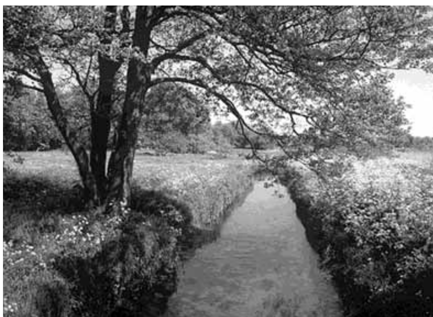
Gasterense Diepje.