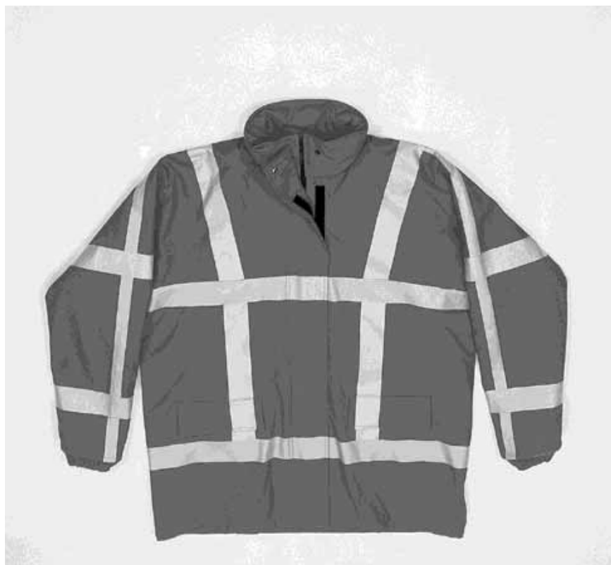
Rijkswaterstaat eist behalve de gangbare horizontale strepen ook verticale strepen op de signaalkleding.

Rijkswaterstaat stelt aan veiligheidskle-