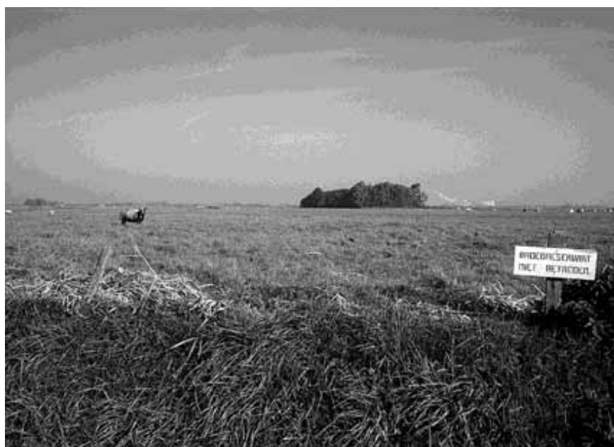
Het aandeel graslanden waar boeren weidevogels beschermen, is toegenomen.