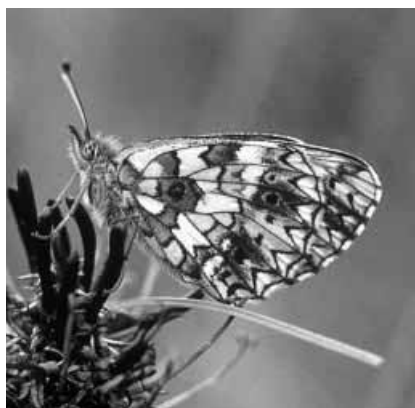
Zilveren maan.

Dit artikel geeft een kort overzicht van enkele mogelijkheden van twee biotische meetnetten. Behalve nuttig is het tellen van vlinders en libellen ook gewoon leuk. Wie mee wil doen kan schrijven, bellen of emailen naar De Vlinderstichting (0317-467346 of vlinders@bos.nl ). Samen met de tellers bezoeken wij alle locaties om eventuele problemen meteen op te lossen. Routes voor zeldzame of rode lijst soorten zijn extra welkom. Tellers ontvangen jaarlijks een overzicht van hun tellingen en de jaarlijkse rapportage over de stand van dagvlinders en libellen in ons land.