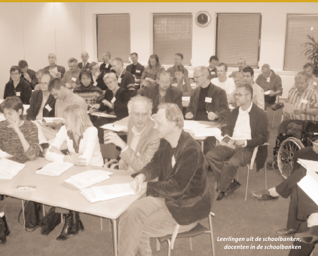
Leerlingen uit de schoolbanken, docenten in de schoolbanken

De afgelopen jaren is het vmbo groen in de steigers gezet. Er is flink gewerkt. Nu de steigers rond het fundament kunnen worden afgebroken, luidde een conferentie op 4 december jongstleden het begin in van het vervolg: het vmbo groen is klaar voor verdere verbouwing.