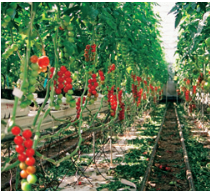
Uit onderzoek blijkt dat het met bladplukken soms wel minderkan.

Bij gerbera, met zijn bladrozetten, zou best wel eens de omgekeerde situatie kunnen gelden. Misschien wordt daar wel te veel blad aangemaakt. Dat is overigens niet duidelijk, want er is weinig onderzoek gedaan. Bij chrysant valt waarschijnlijk weinig te verbeteren. Hier wordt per plantdatum al een andere plantdichtheid aangehouden en is meestal snel een hoge LAI bereikt.