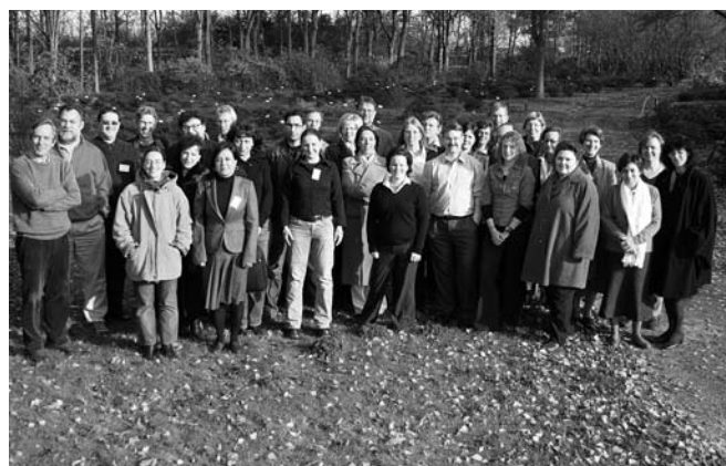
Figuur 4. Deelnemers aan de EUPHRESKO bijeenkomst in Gent, november 2007.