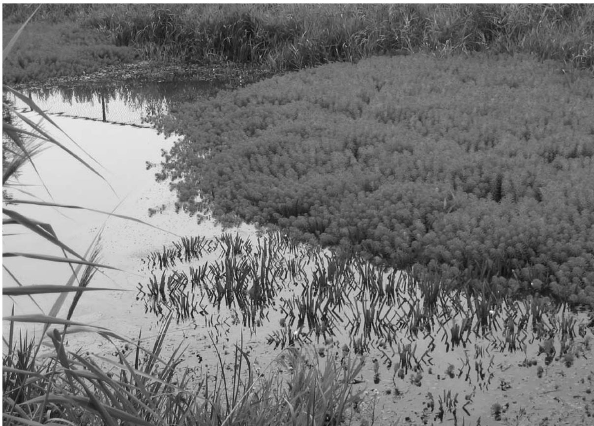
Figuur 3. Het inheemse krabbenscheer (midden) en parelvederkruid (rechts), een exoot uit Zuid-Amerika in een kanaal in Twente.

moeilijk te zijn om consensus te krijgen over de aard van de onderwerpen die in aanmerking zouden komen voor de gezamenlijke onderzoeksprojecten. Het moet natuurlijk gaan om quarantaine-organismen. Verder mag er geen verdubbeling zijn van relevant onderzoek dat reeds gaande was, op nationaal niveau, noch via financiering door een van de EU-Kaderprogramma's. Wat dat laatste betreft: er is juist naar gekeken of de gekozen thema's aan zouden sluiten bij de prioritering van KP7, zonder overlap.