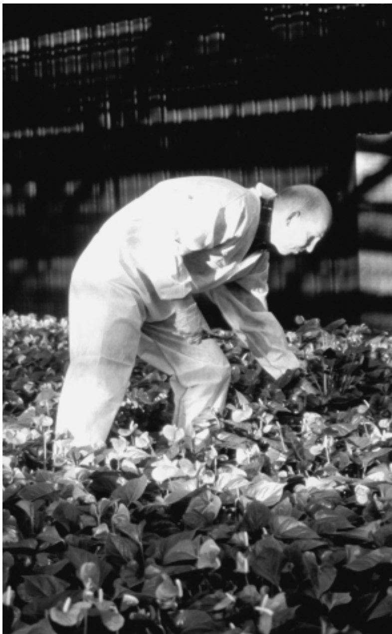
Fig. 2: De PD wil meer bedrijfsprocessen gaan borgen.

Intern is de nota daarmee richtinggevend. De strategienota verschaft externen meer zicht op de werkzaamheden van en de mogelijkheden die de dienst te bieden heeft. Dat laatste is een enorme winst. Externe respondenten gaven meermalen aan dat de PD ongetwijfeld een gedegen organisatie is, maar dat er weinig zicht is op wat de dienst nu eigenlijk precies doet. Van de nota zijn trouwens twee versies verschenen. Eén toegespitst op intern gebruik en een tweede die naar de doelgroepen van de PD zal worden verzonden.