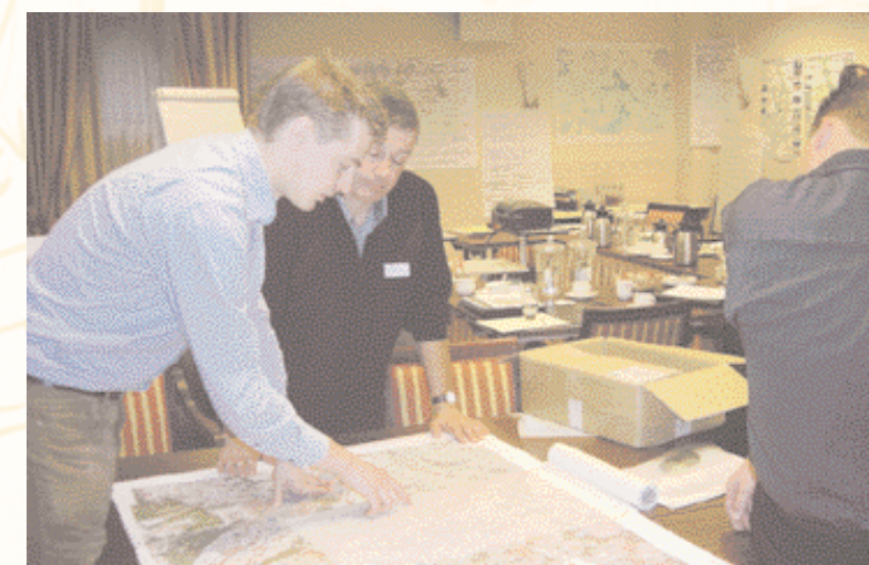
Onderzoekers werken samen met betrokkenen uit het gebied aan een nieuwe inrichting.

Meer informatie vindt u in 'Werk in uitvoering', door A. Wintjes Alterra-rapport 606 Voor prijs en bestelwijze zie pagina 17 e.v.