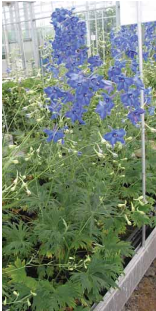
Delphinium belladonna 'Völkerfrieden' stilstaand water in week 29

DELPHINIUM BELLADONNA Het ras 'Völkerfrieden' werd geplant in week 14 (eind maart). De groei van de planten verliep traag. Eerst werden wortels gevormd en pas daarna begonnen de scheuten zich te ontwikkelen. Op 12 juni werden de eerste bloemen geoogst. Daarna werd regelmatig geoogst tot begin september. Op dat moment waren de planten op water grotendeels afgestorven, terwijl in de grond nog nieuwe scheuten tot ontwikkeling kwamen. Uit tabel 1 blijkt dat op potgrond de opbrengst en de kwaliteit van de stelen het beste was. Op stilstaand water en eb/vloed kwamen de planten minder goed tot hun recht dan op stromend water. Op 25 juli is een tweede set