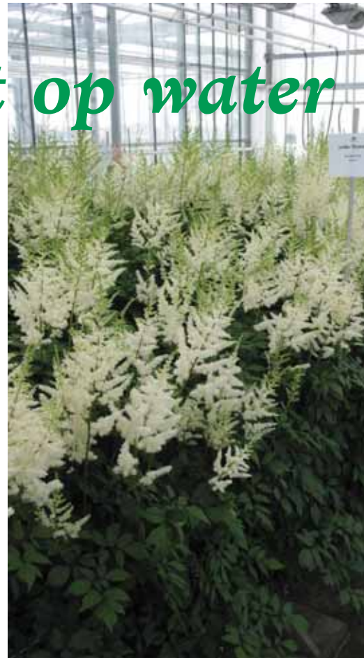
Astilbe 'Diamant' op stromend water in week 25

Delphinium geplant. Deze planting laat hetzelfde beeld zien als de eerste planting. Van dit gewas wordt nog geoogst.