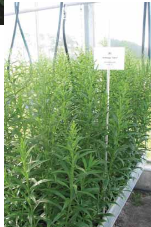
Solidago 'Tara' op stromend water in week 24

Van dit gewas zijn drie cultivars ('Weisse Gloria', 'Erica' en 'Diamant') geplant. Astilbe staat bekend als een waterminnend gewas en de teelt op water verliep dan ook succesvol. Zowel