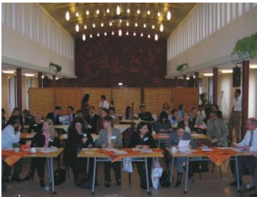
De Technisch Assistenten bijeen tijdens de Meeting Agricultural Assistants (TA-week).

Het ministerie vindt het belangrijk dat de TA's goed op de hoogte blijven van de ontwikkelingen in Nederland. Daarom wordt elke twee jaar de Meeting Agricultural Assistants oftewel de TA-week georganiseerd. Deze week staat in het teken van bijscholing, ervaringsuitwisseling en netwerken, en maakt de geografische afstand tussen de LNV-bureaus en het ministerie voor een week tastbaar kleiner.