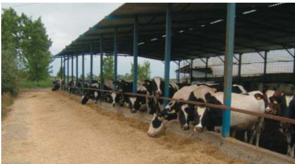
Aandacht voor voeding, veterinaire zaken en verbetering van de melkwaliteit.

De grote zuivelindustrieën onderhielden altijd sterke banden met hun boeren, die begeleiding kregen op het gebied van voeding, veterinaire zaken en verbetering van de melkwaliteit. De grootste Griekse zuivelproducent, Delta, zette alweer jaren geleden een modelboerderij op, waar Veeopro gedurende een reeks van jaren praktijklessen gaf aan de boeren. Inmiddels zijn de banden met de veehouders wat gevierd; enkele zuivelbedrijven importeren nu melk uit andere Balkanlanden (2002: 40.000 ton), waar de producentenprijs beduidend lager ligt. Desondanks staan de ontwikkelingen in de primaire sector niet stil. Drie jaar geleden werd in Thessaloniki de Griekse Holstein Associatie opgericht, met op dit moment ruim 200 leden en meer dan 20.000 geregistreerde runderen. In samenwerking met NRS maakt de Associatie gebruik van het IRIS rundvee-informatiesysteem. In september 2005 kregen Holstein-boeren op drie locaties