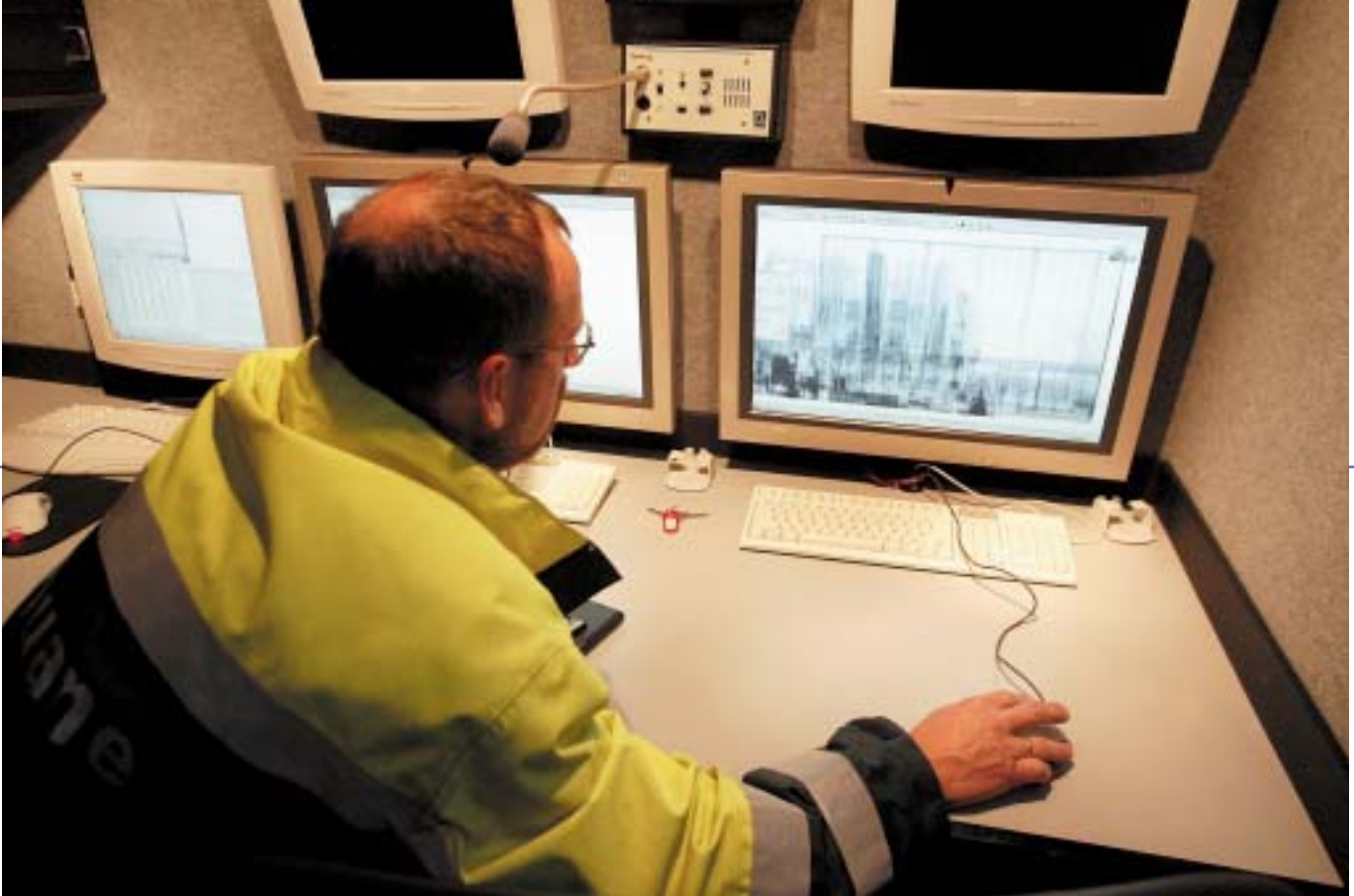
Veel van de controle handelingen spelen ook nu al 'achter het beeldscherm' af.

eisen van derde landen, worden vaak nieuwe garanties toegevoegd of moeten de zekerheden achter een garantie grondiger bewezen worden.