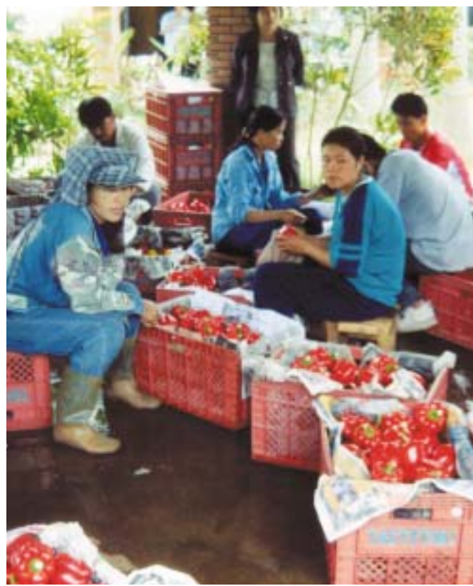
Het sorteren van paprika's op de Chiang Mai Lanna Farm.

Volgens de tijdens de Doha-conferentie gemaakte handelsliberaliseringsafspraken moet Zuid-Korea de komende tien jaar het importquotum van rijst geleidelijk verhogen tot uiteindelijk 8% van de nationale productie. Een steeds groter deel van de geïmporteerde rijst moet direct op de lokale markt worden verkocht. De prijs van geïmporteerde rijst is lager dan de lokaal geproduceerde rijst. Het parlement heeft een voorstel in stemming gebracht om met ingang van 2005 de opkoop van rijst door de staat af te schaffen. Samen met de afnemende rijstconsumptie van de gemiddelde Koreaan (vanaf 1990 een afname met 25%) leidt dit ertoe dat het areaal rijst dit jaar beneden de 1 miljoen ha zakt, wat nog altijd bijna de helft van het totale landbouwareaal is.