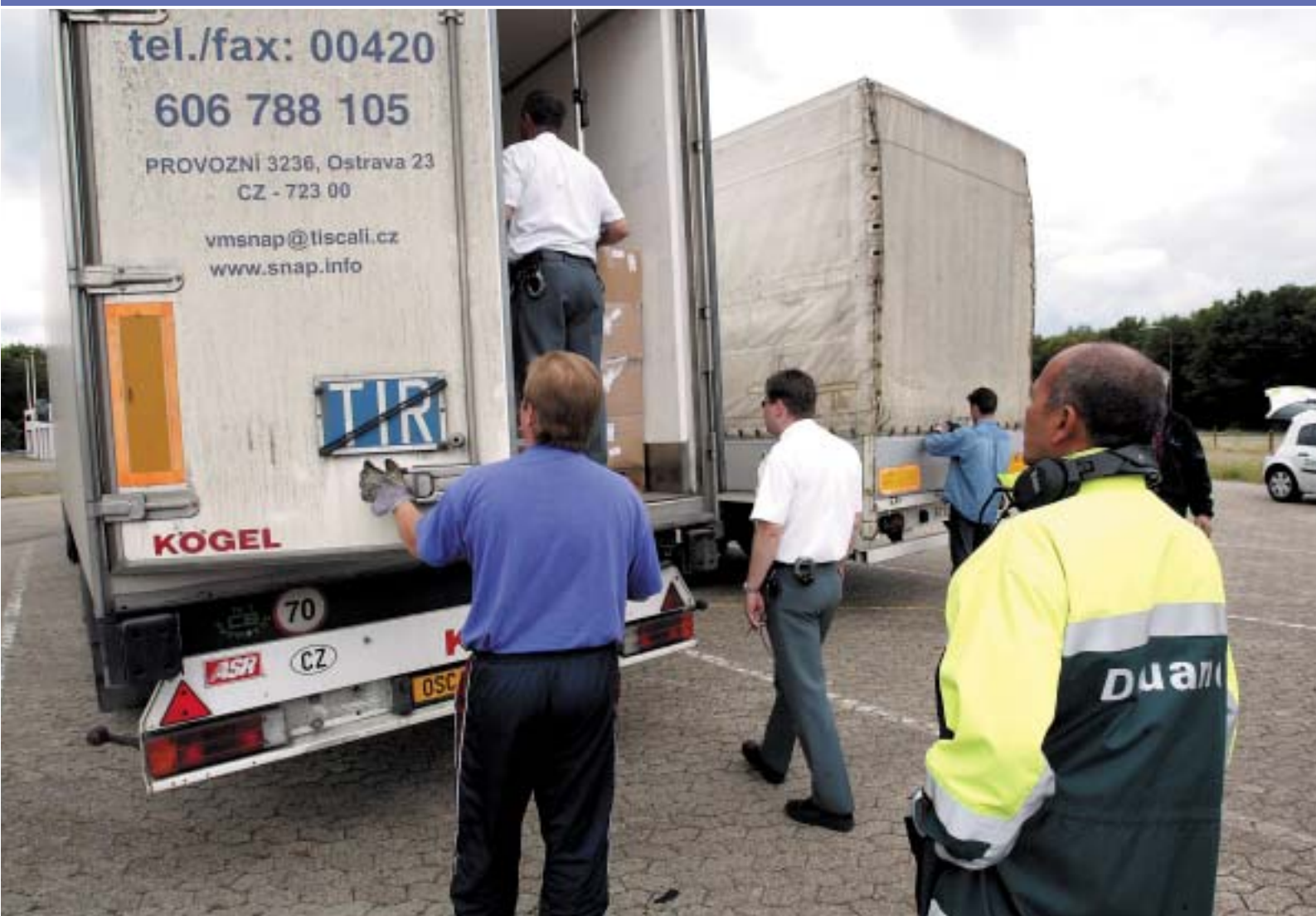
Fysieke inspecties blijven een belangrijk onderdeel van de controles.

Het verbeteren van administratieve en logistieke processen bij zowel overheid als bedrijfsleven door het efficiënter inrichten van informatiestromen en controleprocessen van inkomende en uitgaande landbouwgoederen. Dat is het doel van het ministerie van Landbouw, Natuur en Voedselkwaliteit voor het gestarte programma CLIENT (Controles op Landbouwgoederen bij Import en Export naar een Nieuwe Toekomst). Na een uitgebreide verkenning van de huidige exportcertificeringsprocessen, is de tijd nu rijp voor de realisatiefase van CLIENT Export.