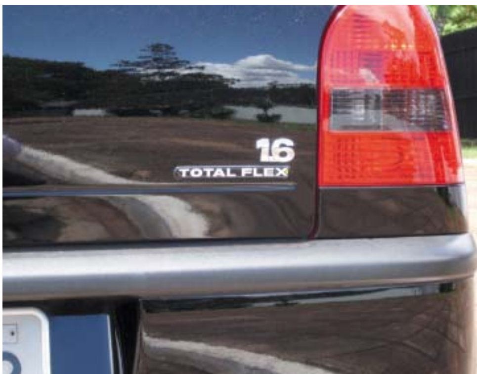
De verkoop flex-fuel auto's groeide in 2004 ca. 350 %.

Volgens de gerenommeerde Universiteit van Campinas (UNICAMP) en het Technologie Centrum voor Suiker (COPERSUCAR) is er voor de nabije toekomst geen ander alternatief dan alcohol voor het wegvallen van de olieproductie. Bovendien stijgt de vraag door de groei van landen als China. Ook de handel in CO 2 is met de inwerkingtreding van het Kyoto-verdrag voor Brazilië uitermate lucra-