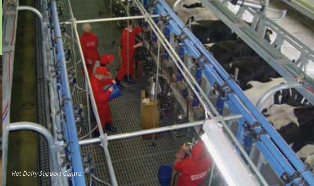
Het Dairy Support Centre.