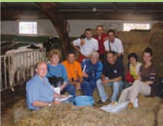
Eerste groep Russen tijdens een training in het PTC+ te Oenkerk.

productie, diergezondheid en melkqualiteit. Veel van deze problemen zijn terug te voeren op een gebrek aan vakmanschap en managementvaardigheid.