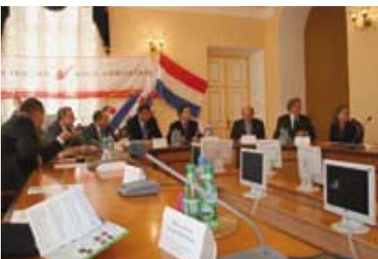
Officiële opening van het Dairy Support Centre, oktober 2005.

CRV (waaronder CR Delta) Trioliet Provimi Bles Dairies Campina Schils Intervet Rabobank Bergum-Oostermeer Rabobank Leeuwarden Wilaard Groep (onder andere Royal De Boer) Delaval Uniform Agri