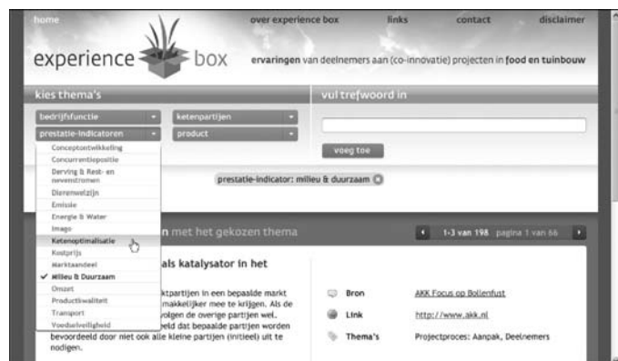
Figuur 2. www.agrologistiek.net/experiencebox

AFSG is de organisatie voor kennisontwikkeling en kennisoverdracht op het gebied van duurzame toepassingen van agrogrondstoffen voor veilige en gezonde voedsel- en niet-voedselproducten. Door slimme combinaties van expertise creëert AFSG inspirerende opties en concrete oplossingen in samenwerking met overheid en bedrijfsleven. Voor meer informatie kunt u terecht op www.AFSG.wur.nl .