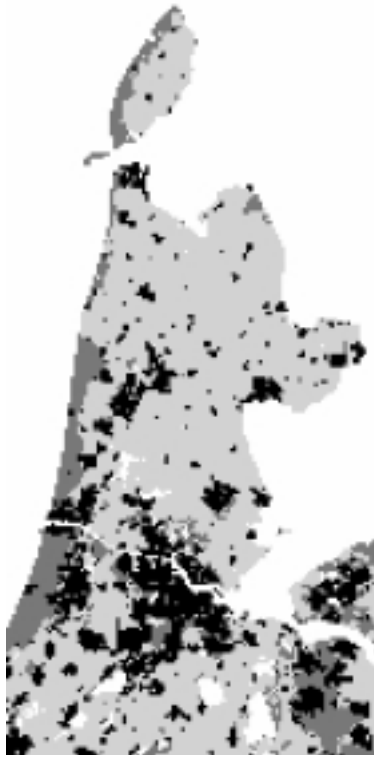
Figuur. 4. Huidig en toekomstig ruimtegebruik voor de beide scenario's.

voor hen meest geschikte locaties toegewezen, wat betekent dat de andere functies soms met tweede keus locaties moeten volstaan. De Ruimtescanner is dus eigenlijk te beschouwen als een instrument dat de meest optimale verdeling van ruimte over de verschillende functies berekent, rekening houdend met hun locatievoorkeur en economische potentie. Als, zoals in deze case, de vraag groter is dan het aanbod zullen bepaalde typen grondgebruik met minder ruimte genoeg moeten nemen. In dit geval is er voor gekozen om de economisch minst sterke functies (grondgebonden landbouw) te laten inleveren. Uit de uiteindelijke aan deze grondgebruiktypen toegewezen oppervlakken kan afgelezen worden hoe groot de discrepantie tussen vraag en aanbod is. Het model houdt tijdens de allocatie geen rekening met toenemende intensiteit (bijvoorbeeld middels hoogbouw) of meervoudigheid van ruimtegebruik (functiecombinatie) als mogelijke oplossing voor ruimtetekort. Overigens kunnen vormen van meervoudigheid wel bij het definiëren van de typologie worden ingebracht. Zo is voor deze studie de functie agrarisch natuurbeheer toegevoegd aan het regionale scenario. Deze agrarische grondgebruikcategorie kan een deel van de vraag naar natuurgrond opvangen.