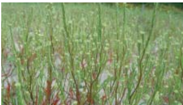
Sommige soorten, zoals smal vlieszaad, zijn juist te vinden op industrieterreinen die regelmatig op de schop gaan.

Voorbeelden: strandplevier, bontbekplevier, kleine plevier, dwergstern, visdief, rugstreepad, smal vlieszaad en kandelaar.