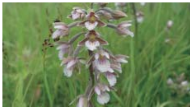
Moeraswespenorchis, een vroege soort, verschijnt pas als de juiste bodemschimmel aanwezig is en verdwijnt weer als zijn leefgebied overgroeid raakt door struweel.