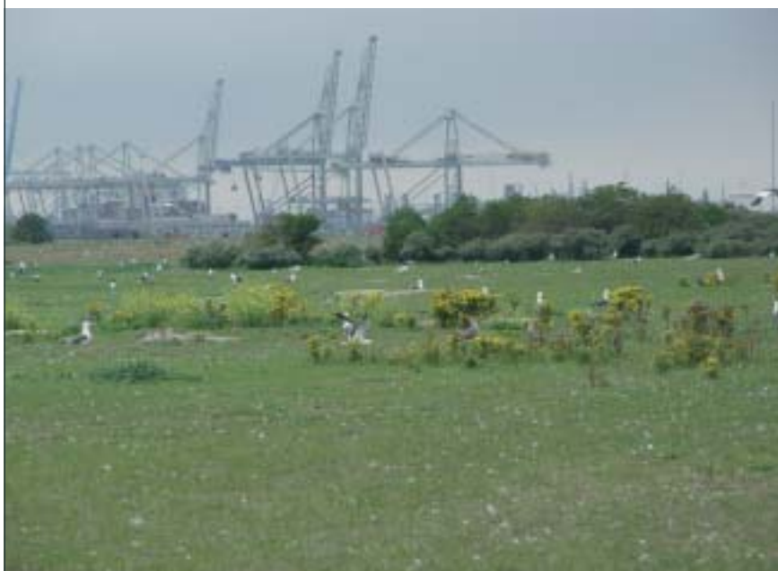
Meeuwenkolonie op de Maasvlakte. Een havenbedrijf, met al zijn natuurlijke en menselijke dynamiek, oefent een grote aantrekkingskracht uit op pioniers als meeuwen.

Een havenbedrijf heeft vele honderden hectares grond klaarliggen voor industriële bestemmingen. Gelegen in de voedselrijke kustzone oefenen deze braakliggende terreinen een enorme aantrekkingskracht uit op kust- en zeevogels. Duinplanten komen vanzelf aanwaaien en voor veel bijzondere insecten vormen de braakliggende gronden een waar eldorado. Het havenbedrijf zou deze planten en dieren graag voor kortere of langere tijd onderdak willen bieden. De maatschappij vraagt terecht om een goede ecologische inpassing van de havenactiviteiten, en beelden van vogelkolonies tussen de terminals passen daar goed bij. De realiteit is echter anders. De Flora- en faunawet staat niet zonder meer toe dat de natuur die zich spontaan op de braakliggende gronden ontwikkelt, na enkele jaren weer verwijderd wordt. Ook niet wanneer de grond eigenlijk een industriële bestemming heeft. Dan moet er ontheffing worden aangevraagd, gecompenseerd en gemitigeerd worden, met alle procedurele rompslomp van dien. Dit weerhoudt het havenbedrijf ervan om spontane natuurontwikkeling toe te laten. De braakliggende gronden worden dusdanig beheerd dat er geen natuur van noemenswaardige betekenis kan ontstaan.