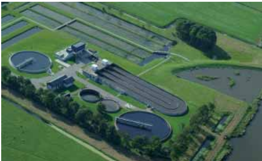
Tabel 2. Globaal overzicht van aanleg- en inrichtingskosten (in euro) van Aqualân Grou

Het zuiveringsmoeras is publiekelijk toegankelijk. Met informatieborden wordt uitleg gegeven over het systeem. Vanaf de vernieuwde kade bij de snoekpaaiploot is er een goed zicht op de rwzi, het moeras-systeem, de Kromme Grou en het Friese landschap. Excursies en lesprogramma's kunnen hier tonen hoe waterketen en watersysteem verbonden zijn. Vanaf dit najaar wordt het systeem gemonitord. Via een serie meetlocaties wordt het effluent gevolgd van nabezinktank via de vijvers en rietsloten tot in het boezemwater. Naast chemische parameters wordt gekeken naar fytoplankton, zoöplankton en waterplanten. In de paaibiotop zal de visstand incidenteel worden bemonsterd. Resultaten van deze voor Wetterskip Fryslân eerste pilot zijn van belang voor verdere polishing van rwzi-effluenten.