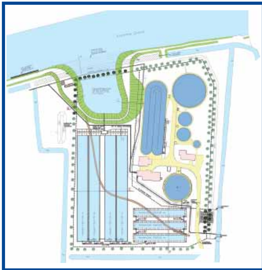
Afb. 2: Technisch ontwerp van het zuiveringsmoeras Aqualân met aansluitend het paabiotoop

de opzichter het idee om dit terrein te benutten voor aanleg van een wetland met eilandje. Aldus geschiedde en dit project werd voorgedragen en gehonoreerd als onderdeel van het zogeheten UWC-project (zie verderop). Het aan te leggen zuiveringsmoeras kreeg de naam Aqualân.