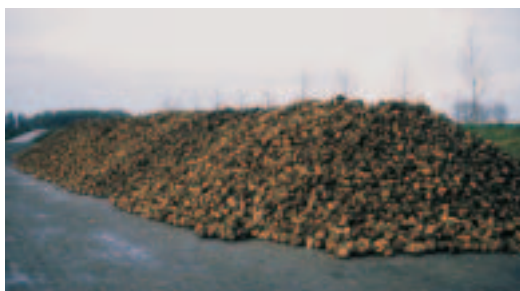
Goed bereikbare dakvormige bietenhoop op verharde ondergrond.

Grondtarra, bietenblad en onkruid tussen de bieten belemmeren de ontluchting van de bietenhoop. De bewaarverliezen nemen toe, omdat de temperatuur oploopt. Iedere tien graden temperatuurstijging in de hoop betekent grofweg een verdubbeling van de suikerverliezen (zie figuur).