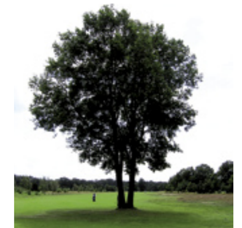
In eerste instantie bestaat een bosplantsoen uit een mengeling van snelgroeiende bomen (wijkers) en langzaam groeiende soorten (blijvers). Door regelmatig de wijkers te verwijderen, via een meerjarig plan, krijg je een mooi plantsoen dat ook oud kan worden.