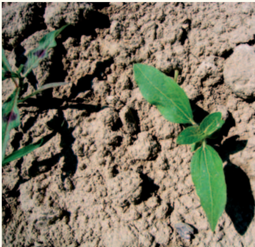
Bingelkruid is in dit stadium goed te bestrijden door Safari, Dual Gold of Frontier Optima in de LDS-combinatie.

combinatie met chloridazon! Centium heeft ook een goede werking op bingelkruid en kleeftkruid, maar heeft vrijwel geen werking op kamille.