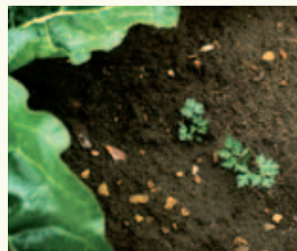
Problemen met hondspeterselie kunt u voorkomen door Centium bij het zaaien toe te passen.

De keuze van de combinatie zou ook afhankelijk moeten zijn van de kosten. Combinaties met Dual Gold of Frontier Optima zijn 20 à 25 euro goedkoper dan combinaties met Safari of clopyralid.