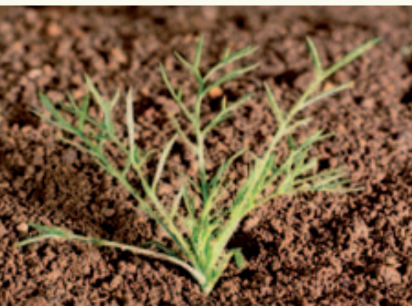
Kamille is in dit stadium moeilijk te bestrijden.

Het beste bestrijdingsmoment van onkruiden is als ze net boven de grond staan. In ieder geval mogen ze niet verder dan het kiemlobstadium zijn. In veel gevallen blijft dan met het 'gewone' lagedoseringensysteem (LDS), bijvoorbeeld 0,5 fenmedifam + 0,5 metamitron + 0,5 ethofumesaat + 0,5 olie, zonder toevoegingen van andere middelen, het perceel onkruidvrij. Zijn de onkruiden het kiemlobstadium ontgroeid, dan moet de dosering van de middelen met 50% omhoog van 0,5 naar 0,75 liter of kg per hectare. Sommige breedbladige onkruiden