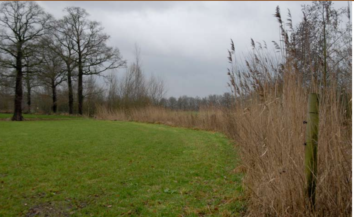
Deze rietkraag markeert een nat beekdal tussen hogere gronden

zien biologische boeren het systeem van beheerssubsidies als niet duurzaam en inflexibel. Een eigen benadering en een nieuw soort betalingssysteem lijken gerechtvaardigd.