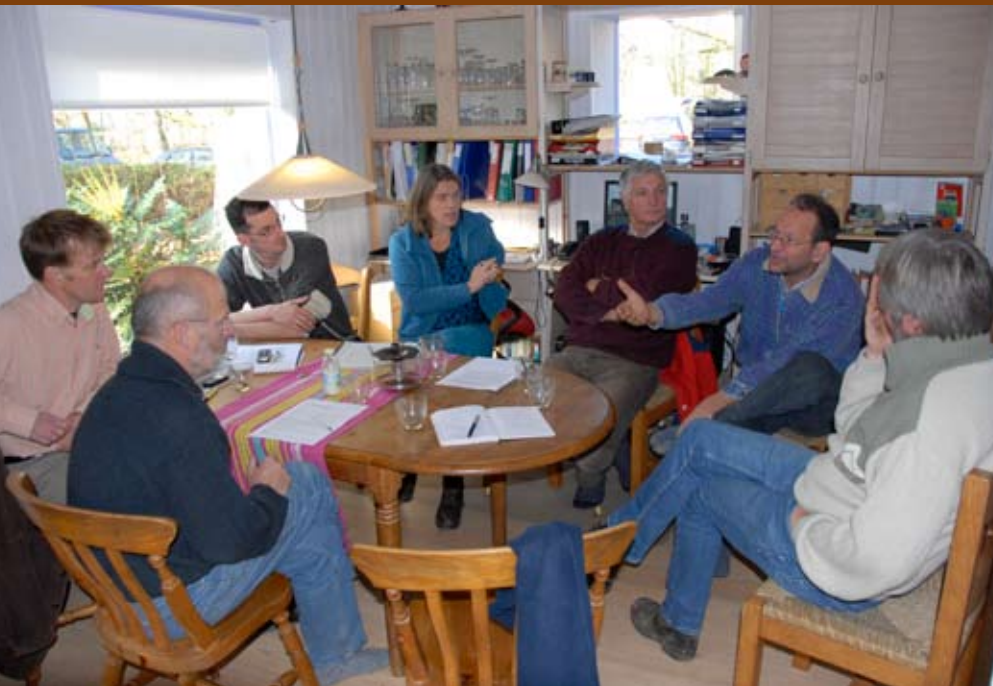
Huiskamerbijeenkomst met boeren uit de Noordoostpolder

Daarbij wordt gekeken naar inkomstender- ving, arbeidsuren en extra investeringen. Uit het onderzoek in de drie regio's blijkt dat een groot deel van de biologische bedrijven van een dergelijk pakket gebruik zou willen maken. Dit zou een extra impuls kunnen betekenen voor het realiseren van de natuurdoelen die de overheid zich ge- steld heeft. Karakteristieke landschappen die nu onder grote druk staan van schaal- vergroting kunnen hiermee behouden blijven. Ook zal het belonen van inzet voor natuur en landschap sommige boeren die nu overwegen om over te stappen naar een biologische bedrijfsvoering, stimuleren om deze stap ook daadwerkelijk te zetten.