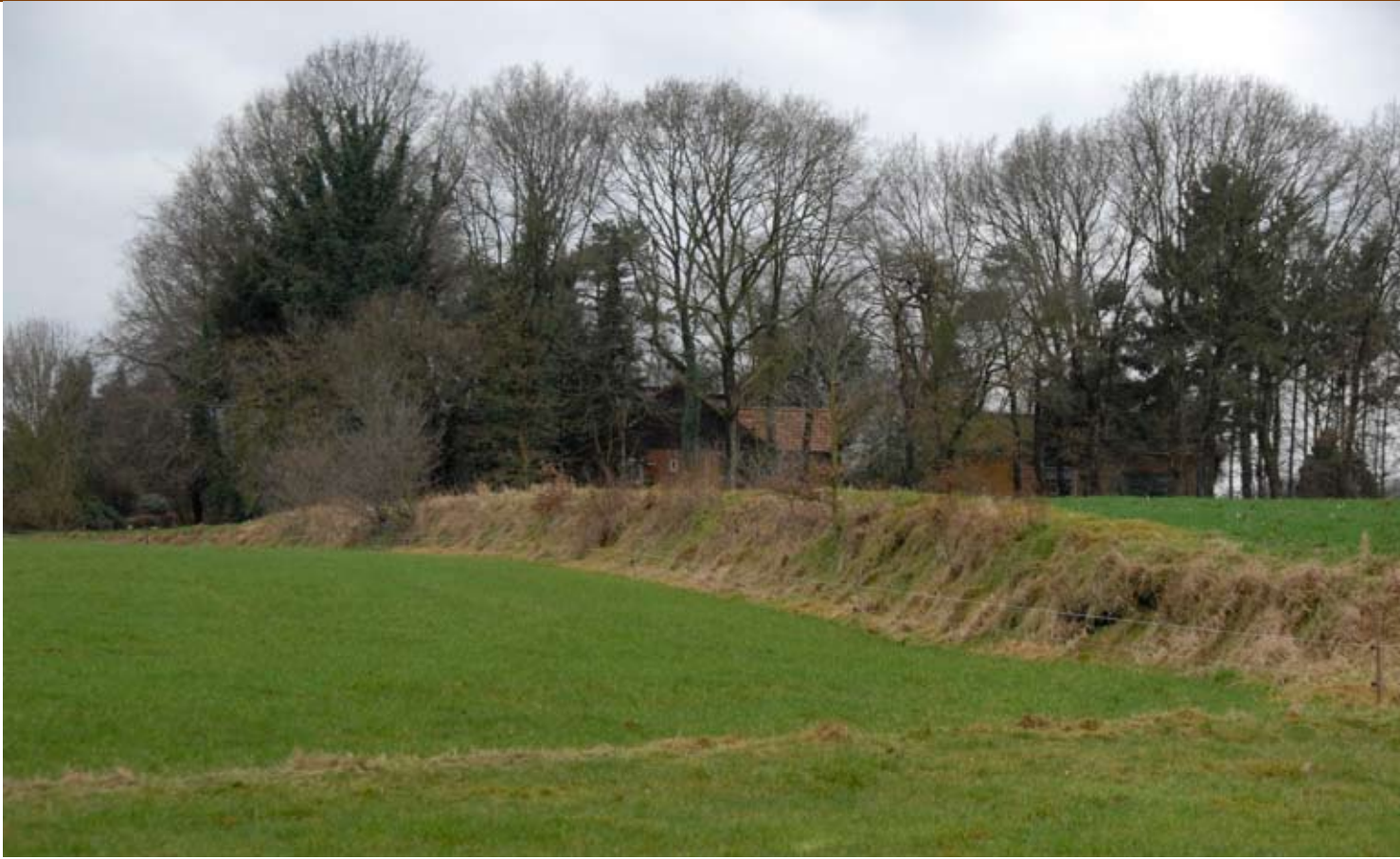
Een steilrand langs hooggelegen oude essen herbergt vaak veel verschillende soorten

toonbaar zijn. Er moeten goede argumenten zijn voor een extra beloning buiten de gangbare instrumenten (SAN) en de Ecologische Hoofdstructuur (EHS) om. De provincies hebben het voortouw als het gaat om de financiering van dergelijke groene diensten (via het ILG). Uit contacten met enkele provincies blijkt dat er in principe mogelijkheden zijn om biologische bedrijven voor hun aantoonbare natuur- en landschapsprestaties te belonen.