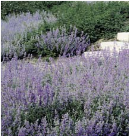
Nepeta is een bodembedekker voor vakken en randen op wat drogere en zonnige locaties. De plant heeft een rustige bloemkleur en is een goede insectenlokker. (Foto: Nepeta (Faassenii groep) 'Six Hills Giant')