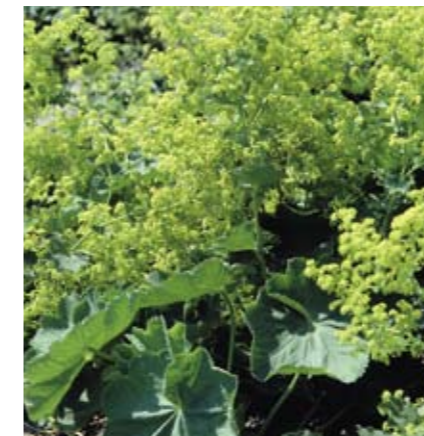
Alchemilla mollis (vrouwenmantel) is een uitstekende bodembedekker met een neutrale kleur. De plant is breed inzetbaar, maar zaait wel uit.

■ GRONDSOORT Kies planten die goed op de betreffende grondsoort kunnen groeien, of zorg voor