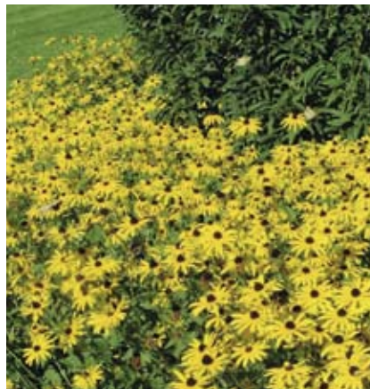
Rudbeckia is als vakbeplanting en als accentplant inzetbaar. De plant heeft een lange, rijke bloei en een mooie winterhabitus. (Foto: Rudbeckia fulgida 'Goldsturm')

Om een goede plantkeuze te maken, is praktijkervaring met vaste planten in openbaar groen erg belangrijk. Als je als gemeente advies inwint bij een kweker, ontwerper of aanleg- en onderhoudsbedrijf, is het nuttig om ook bij afgeronde projecten van deze bedrijven te gaan kijken. Met goed functionerende beplantingen bewijzen zij dat ze het werken met vaste planten in de vingers hebben.