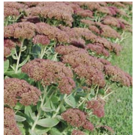
Sedum spectabile (en hybriden) is een accentplant of plant voor kleine vakken en randen, vooral op droge zonnige locaties. De plant heeft een mooie winterhabitus en is een goede vlinderlokker. (Foto: Sedum 'Herbstfreude')