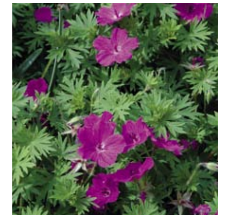
Geranium is een rijkbloeiende dichte bodembedekker. Voor elke locatie is wel een geschikte soort te vinden. De plant doet het ook goed in mengsels. (Foto: Geranium 'Tiny Monster')

Dit is het tweede artikel in een serie van vier over vaste planten in het openbaar groen. Dit artikel behandelt de sortimentskeuze. De volgende artikelen gaan over manieren om vaste planten toe te passen en de organisatie en kennisuitwisseling rond vaste planten. Het vorige artikel in T&L 6 was gewijd aan de voorbereiding.