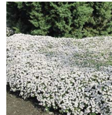
Aster ageratoides is een stevige, gezonde aster voor vakken of randen. Lage en hoge rassen zijn beschikbaar in lichtpaars en wit. Kalimeris incisa is in gebruik vergelijkbaar, maar bloeit eerder. (Foto: Aster ageratoides 'Asran')