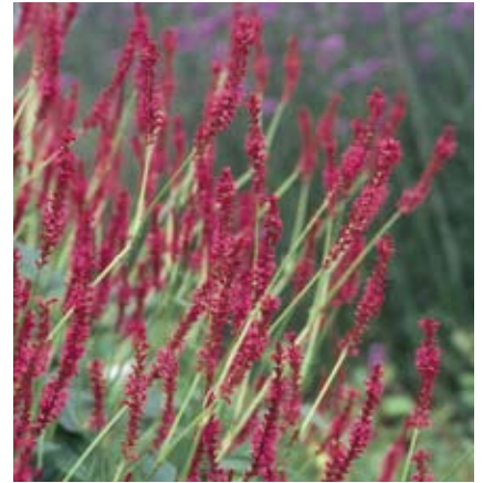
Persicaria amplexicaulis is een hoge plant die snel dichtgroeit. Hij heeft een lange bloei in de nazomer en combineert goed met grassen. (Foto: P. amplexicaulis 'Speciosa')