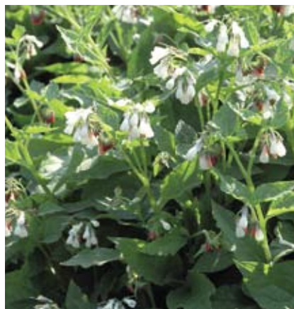
Symphytum staat bekend als een zeer dichtgroeende bodembedekker voor schaduwrijke plaatsen. Hij verdraagt drassige grond goed en fungeert uitstekend onder heesters of als boomspiegel. (Foto: S. grandiflorum)