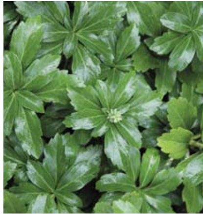
Pachysandra terminalis is een wintergroene halfheester en een prima bodembedekker voor vochtige schaduwrijke locaties. Hij groeit na aanplant niet snel dicht, maar blijft daarna jaren goed. (Foto: P. terminalis 'Green Sheen')