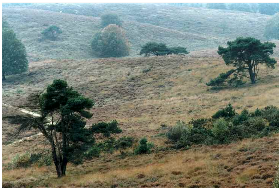
We hechten veel waarde aan het landschap.

Deze brochure vertelt over hoe we natuur ontwikkelen in Nederland. En over de activiteiten die het ministerie van Landbouw, Natuur en Voedselkwaliteit (LNV) onderneemt en stimuleert om nieuwe Nederlandse natuur te ontwikkelen.