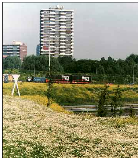
Voorals in de Randstad is weinig natuur.

Voorals in de Randstad is er weinig natuurgebied. Hier wordt vrijwel alle grond voor wonen, werken en vervoer gebruikt. Maar ook in en om de stad is natuur nodig waar planten en dieren ongestoord kunnen leven. Bovendien: als je in de stad woont, wil je ook wel eens naar het bos.