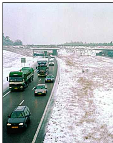
Een wildviaduct. Zo kunnen dieren als egels 'oversteken' van het ene naar het andere natuurgebied.

Natuurgebieden waren dus versnipperd. De overheid stelde zich tot doel om natuurgebieden met elkaar in verbinding te brengen. En om meer samenhang aan te brengen tussen natuurgebieden en hun omgeving. Dat was alleen mogelijk door nieuwe natuurgebieden te ontwikkelen en door ook niet-beschermde gebieden erbij te betrekken. Waarbij ook in die niet-beschermde gebieden planten en dieren moeten kunnen leven.