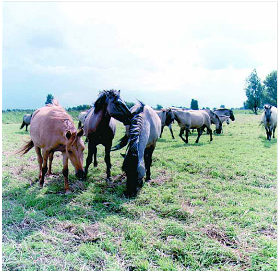
Wilde paarden in de Oostvaardersplassen.

De nieuwe natuurgebieden zijn erg verschillend. Ook in de manier waarop ze na de aanleg beheerd worden. Sommige worden aangelegd en daarna met rust gelaten. Ze worden alleen beschermd tegen slechte invloeden van buitenaf, zodat ze zich zelf kunnen ontwikkelen. Dit gebeurt vooral met gebieden die veel tijd nodig hebben om zich te ontwikkelen zoals oerbossen op zandgrond. Andere gebieden worden in hun ontwikkeling begeleid. Bijvoorbeeld door er verwilderde koeien (zoals Schotse hooglanders) of paarden uit te zetten die ervoor zorgen dat niet overal bos komt. Maar er is ook nieuwe natuur die intensiever beheerd wordt, bijvoorbeeld door te maaien. Zo krijgen planten die er niet vaak voorkomen ook een kans om er te groeien.