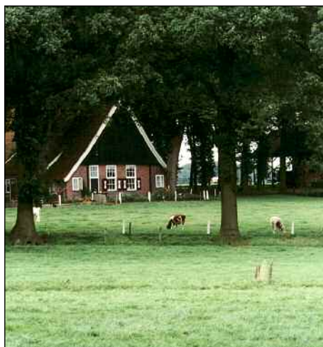
In de loop van de twintigste eeuw ontstond steeds minder ruimte voor natuur.

Vanaf de jaren vijftig begon dit een serieus probleem te worden. De oppervlakte natuurgebied nam af, evenals het aantal verschillende planten- en diersoorten in Nederland. Sinds 1900 zijn er van de veertienhonderd plantensoorten in ons land vijftig uitgestorven. En nog eens ruim vierhonderd worden bedreigd.